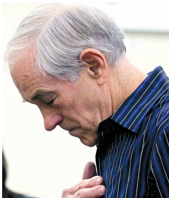
Mitt Romney (en haut), favori dans les sondages ces derniers jours, ainsi que les candidats Rick Santorum (à gauche) ont terminé au premier rang avec 25 % des voix, tandis que Ron Paul a obtenu 21 %.