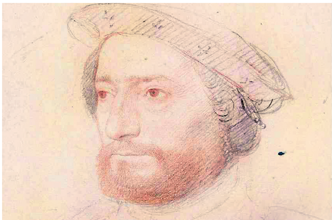
JEAN DE LA ROQUE, SEIGNEUR DE ROBERVAL EN VALOIS / FRANÇOIS CLOUET (COTE ART360256) Jean-François de la Roquette, seigneur de Roberval

Pendant les années 1530, les voyages de Jacques Cartier avaient été réalisés sous le signe de l'exploration. Mais quand le roi François I er envoya sur place le seigneur de Roberval, un militaire qui