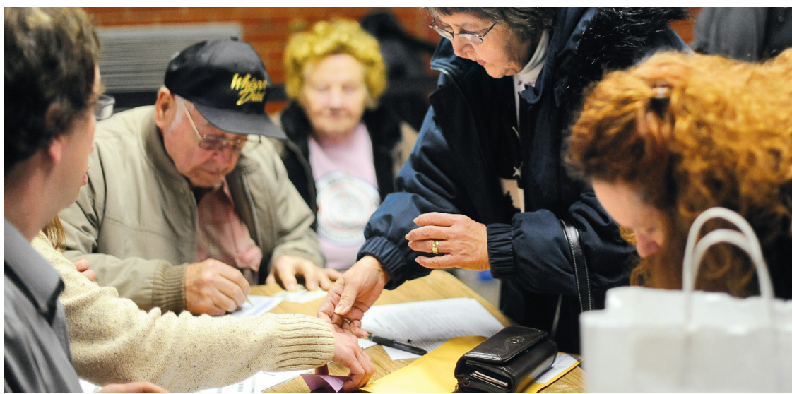
Des républicains s'inscrivent dans une école de Des Moines, en Iowa.

Au moment même où les caucus républicains avaient lieu, le président Barack Obama a tenu un événement web destiné aux militants démocrates de l'Iowa. Il y a dressé un bilan de son mandat,