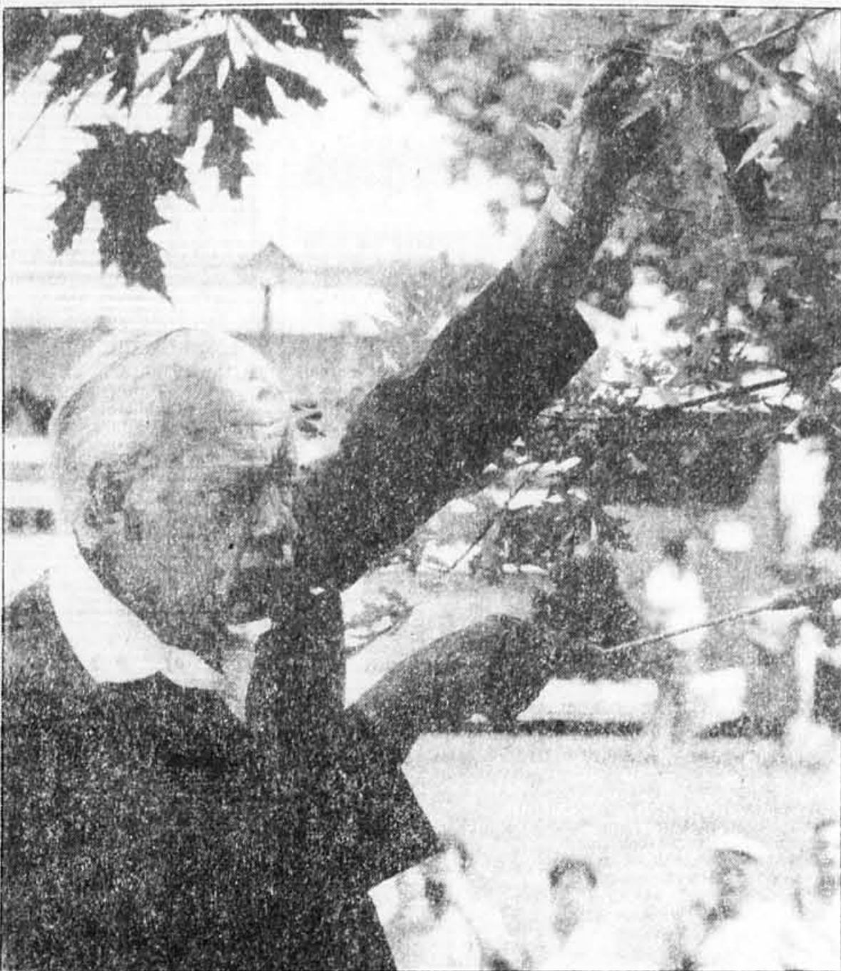
Le premier ministre Lévesque s'est amusé à jouer au chef d'orchestre, hier. Et ses mimiques n'avaient rien à envier à celles d'un Charles Dutoit...