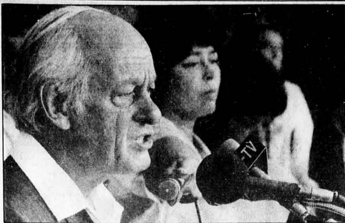
Même en campagne pour le leadership du PQ, les quatre ministres candidats n'en conservent pas moins leurs responsabilités ministérielles, a souligné M. Lévesque hier à Joliette.