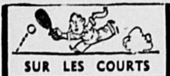
SUR LES COURTS