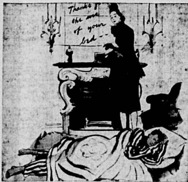
MERLE OBERON AU PALACE — Scène de "The Gay Lady", le dernier film de Merle Oberon, qui prend l'affiche aujourd'hui au Palace.