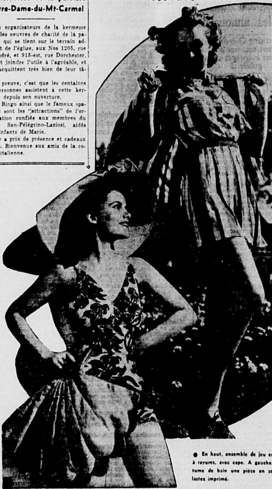
En haut, ensemble de jeu en soie à rayures, avec cape. A gauche, costume de bain une pièce en soie et lastex imprimé.