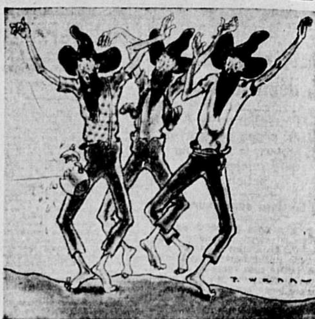
L'IMPERIAL — Les Ritz Brothers dans "Kentucky Moonshine", qui passe présentement à l'écran de l'Imperial.