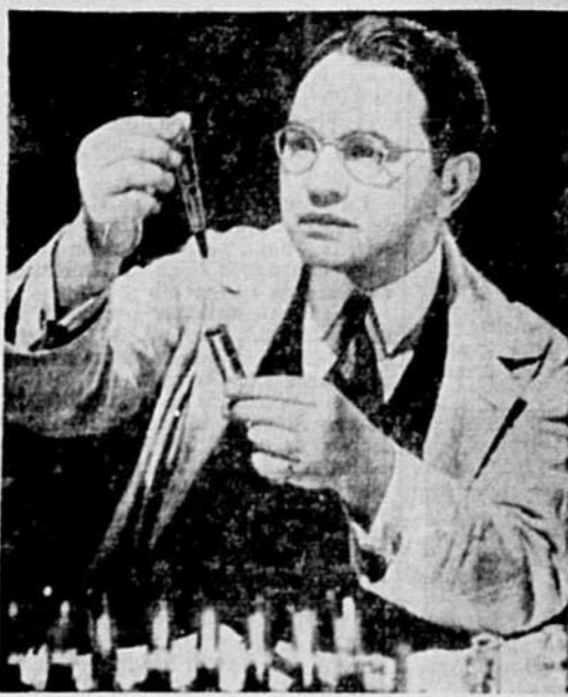
THE AMAZING DR CLITTERHOUSE — C'est Edward-G. Robinson, rôle-titre du nouveau film du Capitol.