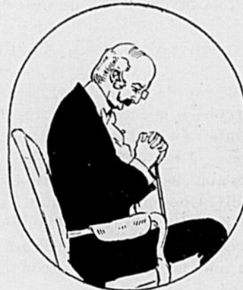
LE THÉÂTRE. — Chez moi, on est doucement bercé par la musique.