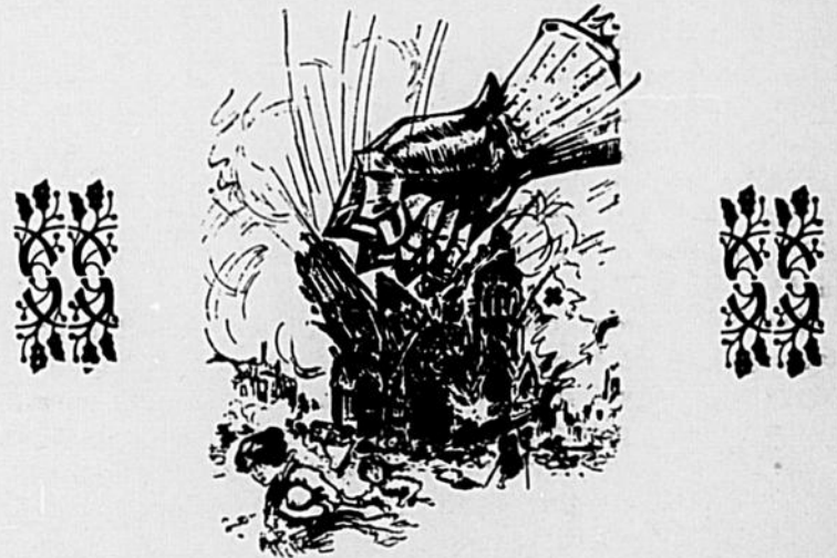
La kultur teutonne

Depuis quelques jours, la population de la bonne ville de Londres était mise en émoi par des incursions d'avions boches, quelquefois de simples aéroplanes, d'autres fois par des zeppelins. Tous ont lu dans les journaux les comptes-rendus de ces