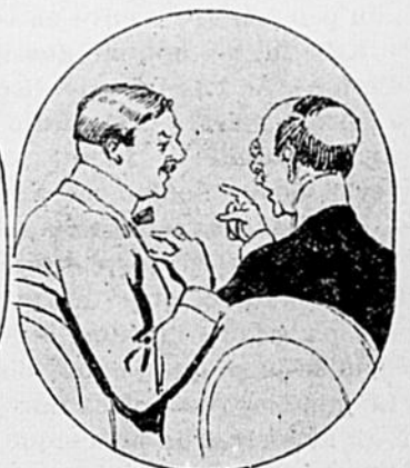
LE CINÉMA. — Et chez moi donc!... Tout le monde cause.