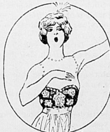
LE THÉÂTRE. — Chez moi on est charmé par le son de la voix humaine.