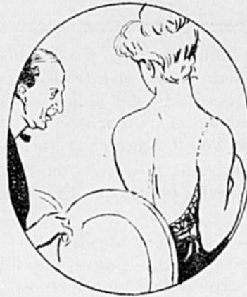
LE THÉÂTRE. — Chez moi on voit de belles épaules.