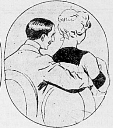
LE CINÉMA. — Oui, mais chez moi on peut les toucher!