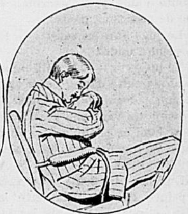
LE CINÉMA. — Oui, mais chez moi on dort plus confortablement.