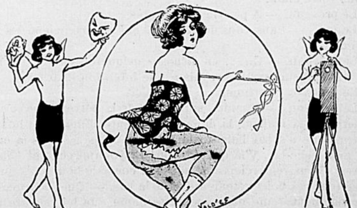
LE THÉÂTRE. — Eh! bien et cela?... En voit-on autant chez vous?