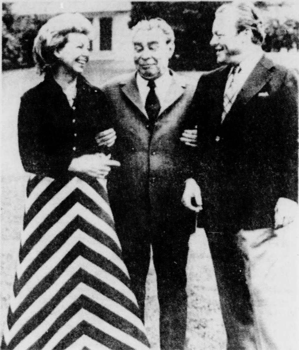
M. Brejnev, au centre, est accueilli à la résidence du chancelier Willy Brandt à Bonn. On le voit ici en compagnie de Mme et de M. Brandt.

Ces moments de détente auront toutefois été brefs. Un nouveau tête-à-tête avec le chancelier est prévu dans l'après-midi pour un examen du communiqué. En outre, M. Brejnev accueillera le soir, au Petersberg, quelque 130 invités pour un grand dîner qui marquera la fin de la partie officielle de la première visite en RFA d'un chef du Kremlin soviétique. Il partira mardi matin vers Moscou.