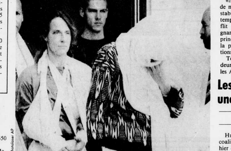
Le major Rhonda L. Cornum, un médecin chirurgien dans l'armée américaine, faisait partie hier des 35 derniers prisonniers de guerre libérés à Bagdad (l'Irak prétend ne plus en avoir). Mme Cornum est apparue avec deux bras fracturés, mais l'armée américaine a affirmé que les prisonniers avaient été bien traités. Ce médecin était tombé dans les filets irakiens la semaine dernière lors d'une opération de sauvetage.