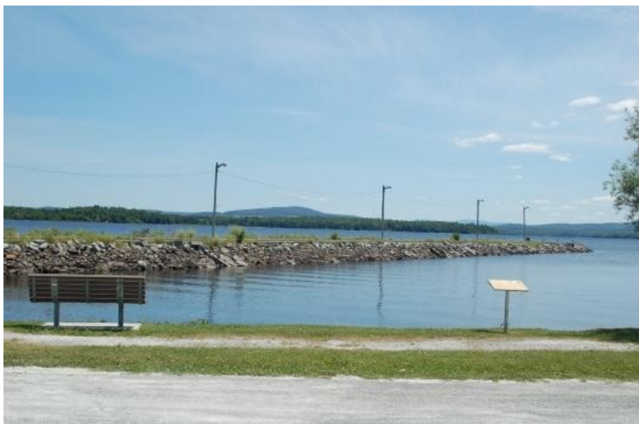
Beaulac-Garthby, un bel endroit pour prendre une marche sur le bord du Lac Aylmer

Postes Canada Numéro de la convention 400699967 de la Poste-publication Retourner les blocs adresse à l'adresse suivante: Fédération des familles souches du Québec C.P. 10090, Succ. Sainte-Foy, Québec (QC) G1V 4C6 IMPRIME—PRINTED SURFACE