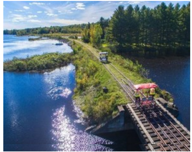
Les Vélorails à Beaulac-Garthby, l'une des activités que nous propose Colette Grondin, dans le cadre de notre rassemblement de Septembre 2020.