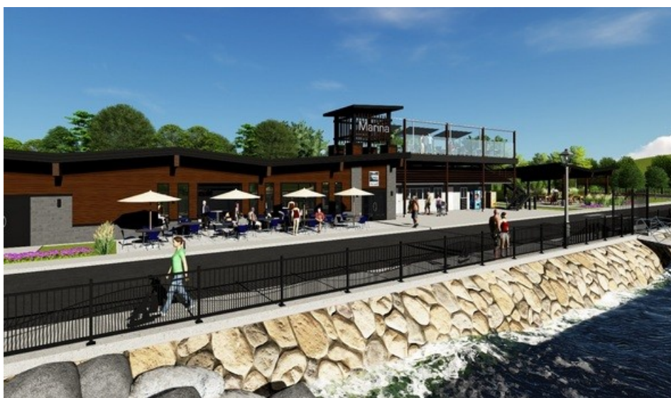
Disraeli, la Marina municipale Un attrait touristique de choix