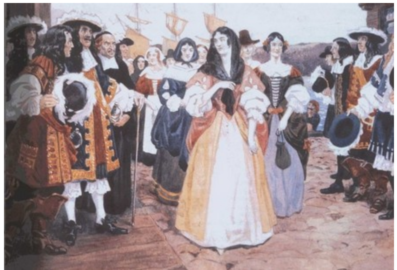
Les filles du Roy. Image digitale d'une peinture de Charles William Jefferys, peintre, illustrateur, auteur et enseignant canadien, surtout connu pour ses représentations historiques.