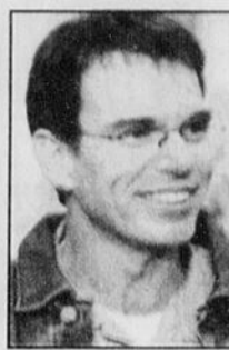
Billy Bob Thornton

Beautiful Mind» et Billy Bob Thornton, Will Smith pour «Ali», Kevin Spacey pour «The Shipping News» et Denzel Washington pour «Training Day».