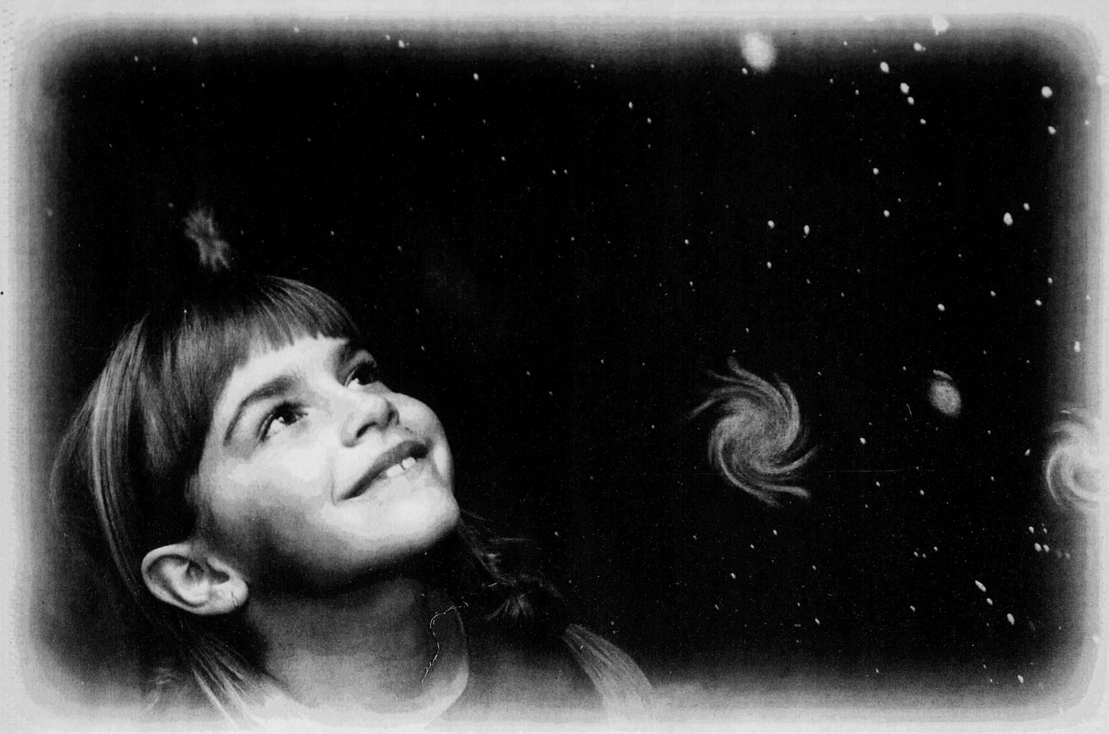
Imacom, Martin Blache