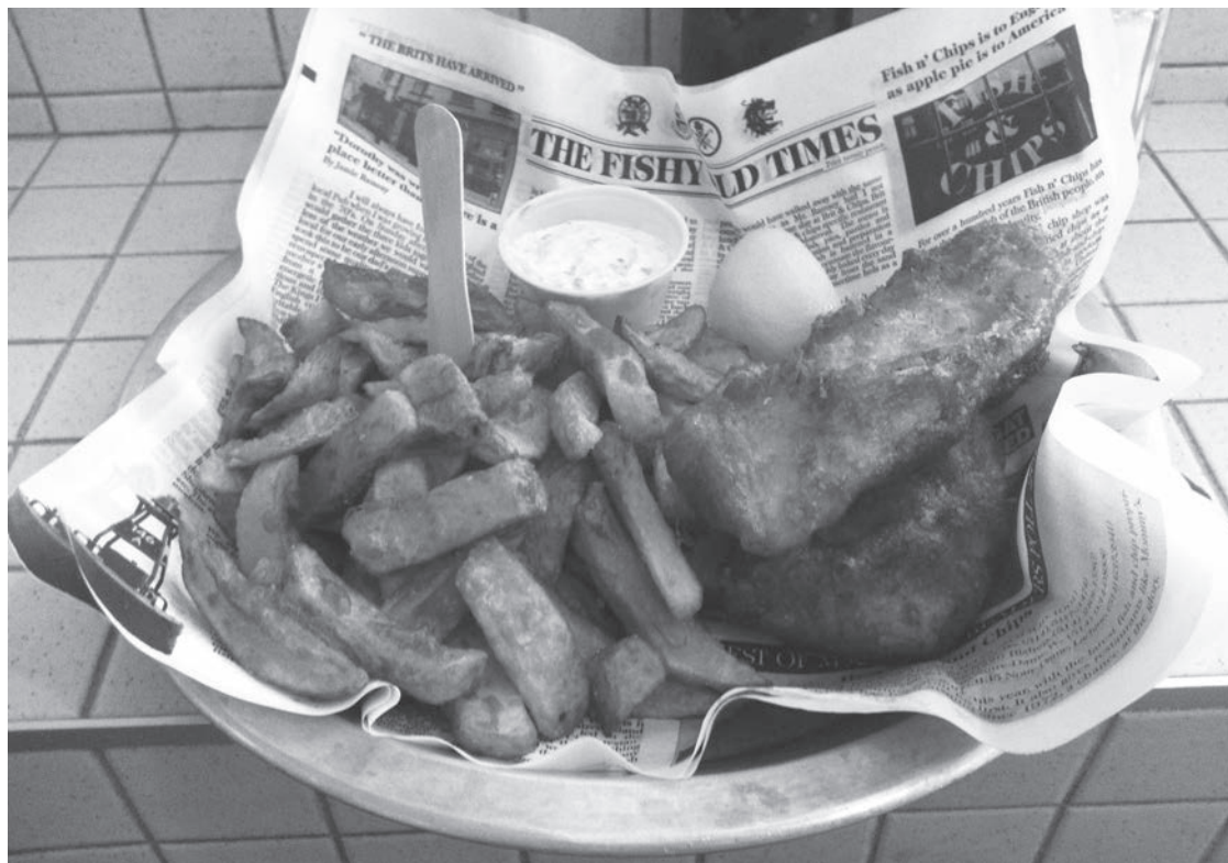
Un délicieux Fish'n Chip accompagné d'un citron et de la sauce tartare

Le local de cette franchise est relativement petit et puisque la cuisine n'est pas dans une pièce séparée de la salle à manger, cette dernière sent beaucoup la friture. Si vous y allez l'hiver, il est certain que vos vêtements et votre personne sentiront un peu la graisse : vous êtes avertis. Par contre, les frites sont réellement excellentes et parmi mes préférées à Montréal, alors ça vaut la peine d'y aller et de surmonter ce léger inconvénient. Comme tout bon fast food, le Frites Alors propose des variations de poutines, hamburgers et sandwich. La plupart des plats sont accompagnés de frites et d'une sauce au choix. Tout comme les frites, les sauces sont aussi très bonnes. À noter : l'endroit sert aussi de la bière.