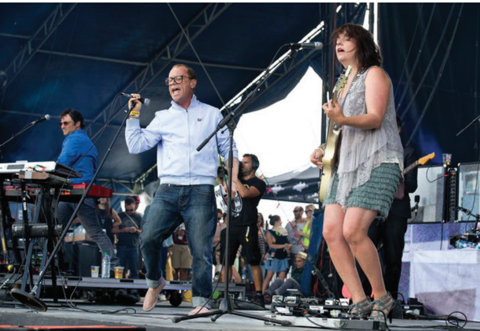
« J'ai un micro et je peux dire ce que je veux. »