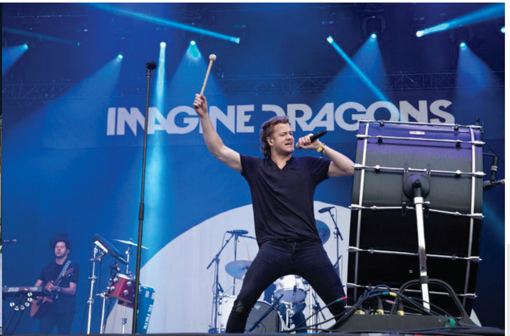
Le gargantuesque « bass drum » de Imagine Dragons