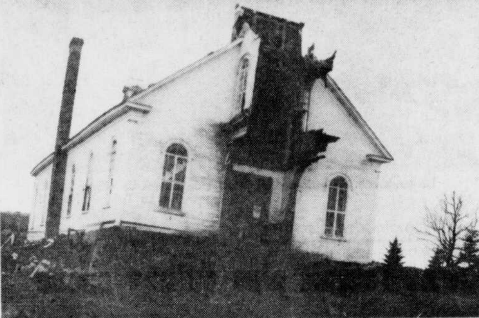
L'église paroissiale d'Audet tombe lentement sous le pic des démolisseurs. Sur son emplacement s'élèvera un temple de dimension plus modeste.

Il a déclaré qu'il s'agissait là d'une expérience qu'il ne souhaitait à personne.