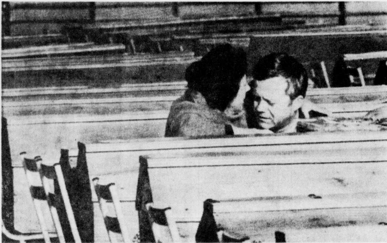
Les parents de deux des victimes de l'incendie, qui a fait 144 morts, dans une salle de danse, en fin de semaine, en France, pleurant sur le cercueil de leurs enfants. Toutes les tombes sont fermées. (Voir nouvelle page 18)