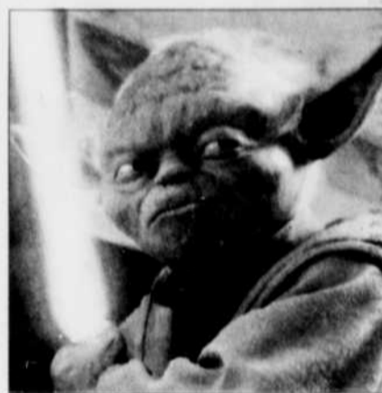
Le maître Jedi

■ Des millions de fans de La Guerre des étoiles attendent impatientement la sortie du sixième et dernier film de la série épique de George Lucas, La Revanche des Siths le 19 mai. Dans celui-ci, le jeune héros Anakin Skywalker se laisse séduire par le côté obscur de la force et devient Darth Vader.