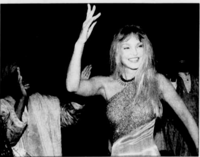
Arielle Dombasle change diamétralement de cap musical.

Voilà pourquoi la femme du philosophe Bernard-Henri Lévy met sa carrière cinématographique en veilleuse et désire ne se consacrer qu'à la musique. « En concert, vous êtes maîtresse de votre art. Vous êtes quelqu'un qui chante et qui enchante, alors qu'au cinéma, vous jouez un rôle. Et il y a tellement de gens autour de vous, de paramètres... »