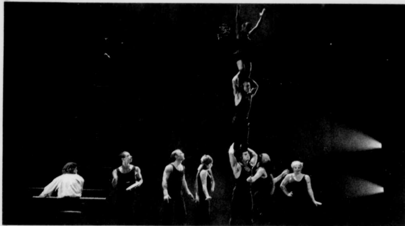
Un des spectacles du cirque Eloize présentés à l'été 2004. Cette troupe, comme d'autres, pourra bénéficier des services de la Tohu, la Cité des arts du cirque.