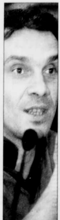
Manu Chao a participé à la création de l'album de sensibilisation au réchauffement climatique.