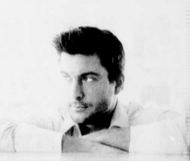
Le dernier CD du Madelinot de 30 ans

Déménagé en banlieue à Saint-Jérôme, Painchaud a replanté ses pieds sur une terre plus semblable à celle des Îles-de-la-Madeleine de son enfance.