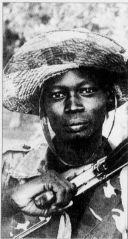
Environ 300 000 enfants participent à des guerres.

■ Une reprise à Télé-Québec vaut vraiment la peine d'être vue pour ceux qui l'ont manquée. Dans le documentaire australien Les enfants soldats , on suit quelques bambins qui doivent combattre malgré eux dans des conflits armés. L'ONU interdit pourtant l'utilisation des enfants, mais une quarantaine de pays comme l'Ouganda, le Colombie et le Sierra Leone transgressent cette règle. Certains d'entre eux ont même jusqu'à huit ans! On évalue à environ 300 000 enfants qui prennent part à des guerres. Souvent, on les kidnape et on les force à participer à des conflits qu'ils ne comprennent même pas à cause de leur jeune âge. À 21 h, une discussion sur ce sujet aura lieu à l'émission Points chauds en compagnie entre autres de l'ancien général Roméo Dallaire. Les enfants soldats et Points chauds , Télé-Québec dès 20 h.