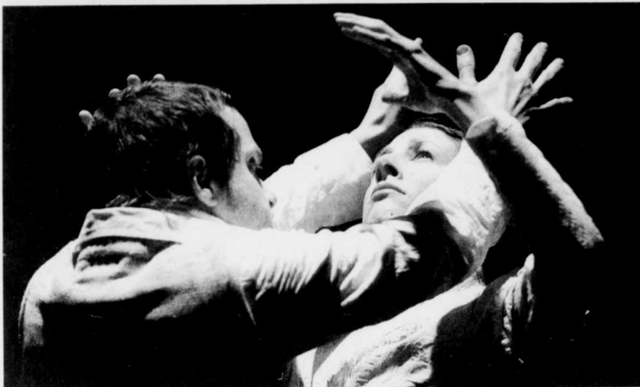
Dernières représentations de la pièce « Cendres sur les mains » de Laurent Gaudé cette semaine, de mardi à samedi à 20 h au Théâtre Périscope, 2, rue Crémazie Est. Réservations : 529-2183.

CINÉPLEX ODÉON SAINTE-FOY (871-1550). Ils se marient et eurent beaucoup d'enfants (3) 12h40, 15h05, 19h10, 22h (G). Enron: Derrière l'incroyable scandale (4) v.o. s-t 13h15, 15h40, 18h35, 21h05 (G). Kingdom Of Heaven (1) v.o. 13h10, 16h30, 20h30 (13 ans). Crash (4 1/2) v.f. 13h, 15h55, 18h55, 21h25 (13 ans). La maison de cire (1) 12h35, 15h20, 19h, 21h50 (13 ans). XXX: L'état de l'union (1) 12h50, 13h25, 15h30, 15h45, 18h30, 19h20, 21h, 21h45 (13 ans). L'interprète (3) 12h45, 13h05, 15h35, 16h05, 18h45, 19h05, 21h35, 21h50 (G). Amityville: La maison du diable (2) 14h30, 16h35, 19h30, 21h55 (13 ans). Une histoire de Sin City (2 1/2) 18h40, 21h20 (16 ans). Genesis (4) v.f. 12h30 (G). Robots (3) 12h55, 15h10 (G). La chute (5) 13h35,