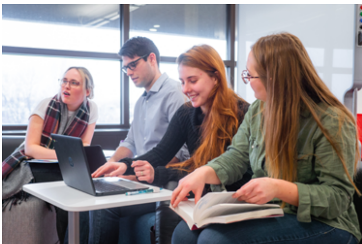
L'Espace Moebius est avant tout un lieu favorisant la collaboration.

« Les étudiants vivront des expériences qui enrichiront leur parcours éducatif, souligne-t-elle. En plus de leur permettre de perfectionner leurs compétences technologiques, un lieu comme celui-ci leur offre la chance de développer des qualités devenues essentielles sur le marché du travail comme la collaboration, la créativité et le travail