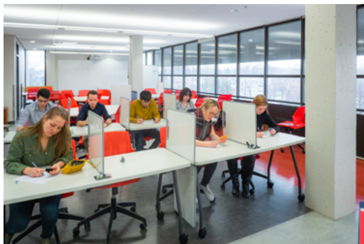
Le mobilier de l'Espace Moebius est facilement adaptable à divers besoins.