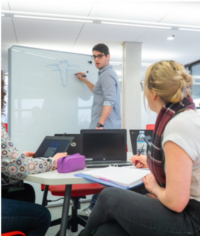
Des tableaux muraux et mobiles font partie du mobilier offert à l'Espace Moebius.

d'équipe. L'un des objectifs de l'Espace Moebius consiste d'ailleurs à offrir aux étudiants l'occasion de vivre des situations d'apprentissage variées, susceptibles de maximiser leur participation vers l'atteinte d'une maîtrise de leurs compétences. »