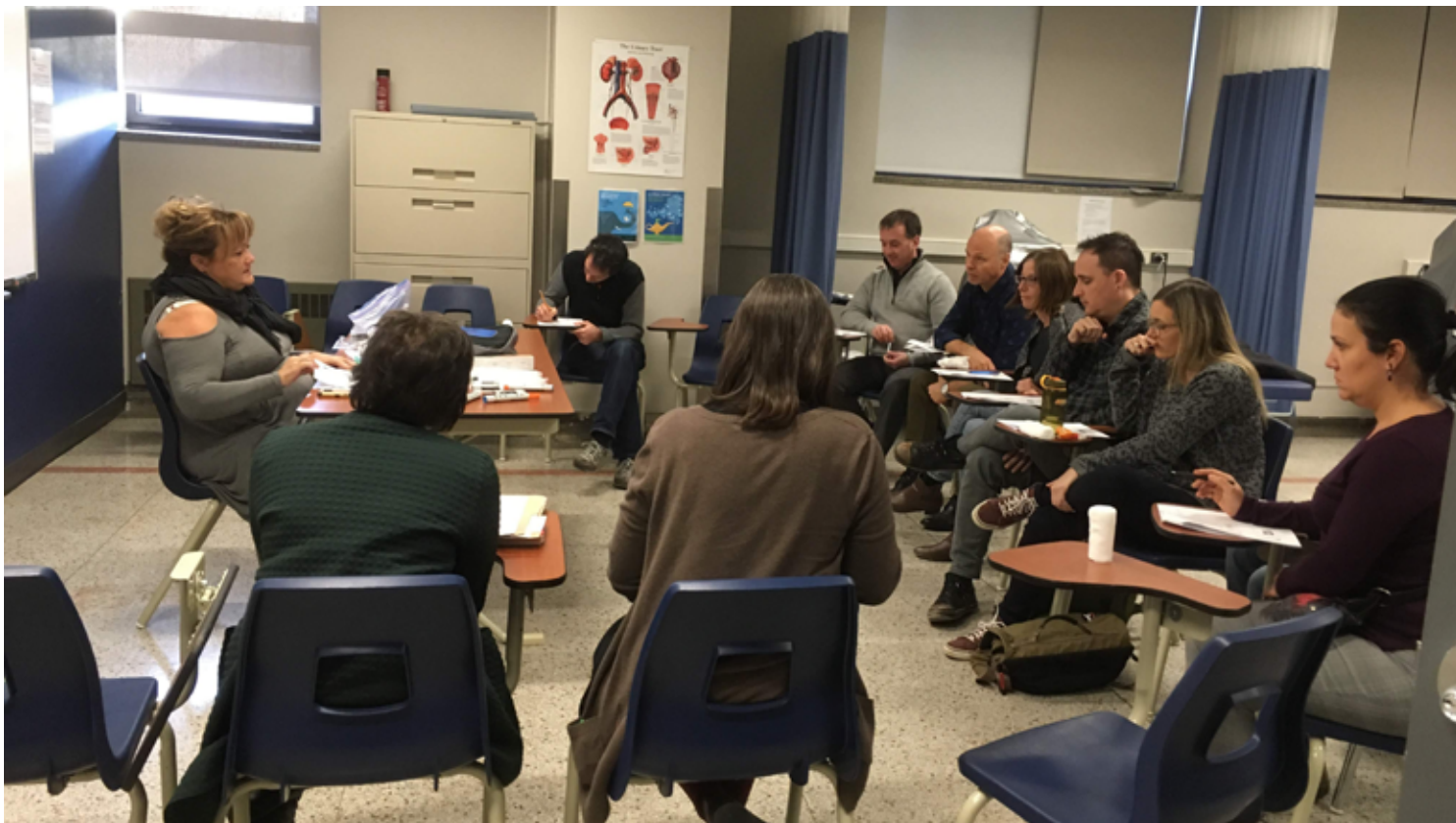
La formation complète a permis aux accompagnateurs de partager leur expérience et d'échanger entre eux.

en décembre 2018, une représentante de la Direction des affaires internationales (DAI) de la Fédération des cégeps et la responsable de la mobilité étudiante du Cégep Marie-Victorin ont assisté aux activités de la matinée pour s'inspirer des pratiques de notre Cégep.