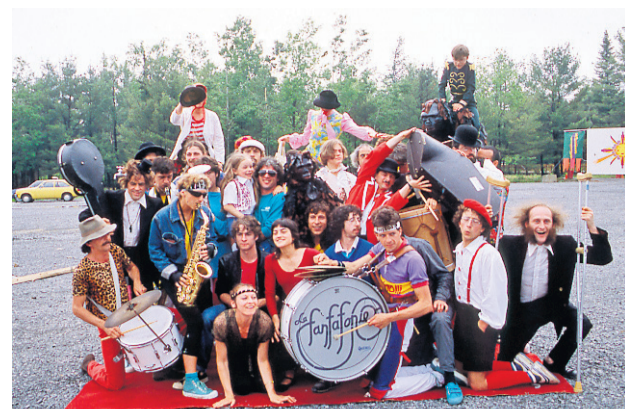
L'équipe du Cirque du Soleil à Montréal en 1987.