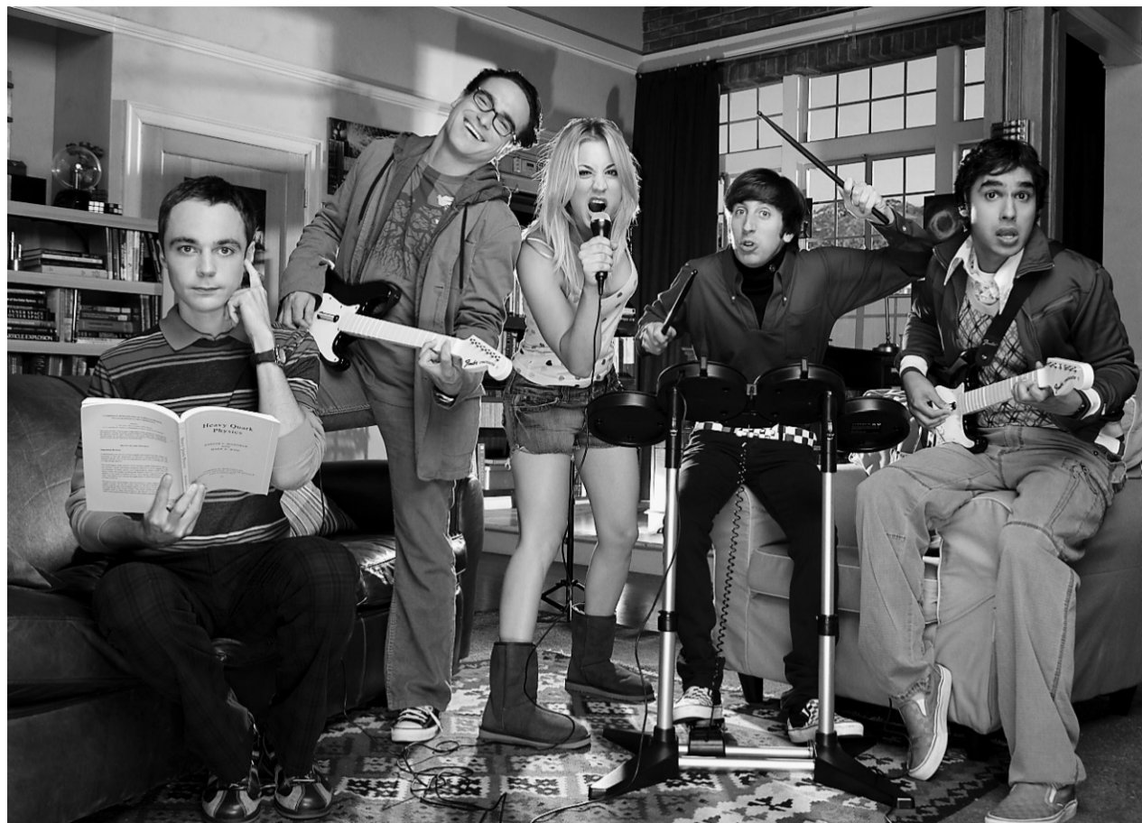
The Big Bang Theory raconte la vie linéaire de deux coloc à la fin de la vingtaine, Sheldon (avec un livre) et Leonard (avec une guitare), que l'on voit avec leurs amis Penny, Howard et Rajesh.

Aux États-Unis, cette sitcom de facture classique, tournée dans des décors très rudimentaires et devant un public hilare, a décollé très modestement dans les sondages Nielsen, en septembre 2007, avant d'exploser dans sa deuxième saison, diffusée par CBS et sur A Channel chez nous. Toutes les semaines, plus de 10 millions de téléspectateurs américains rigolent