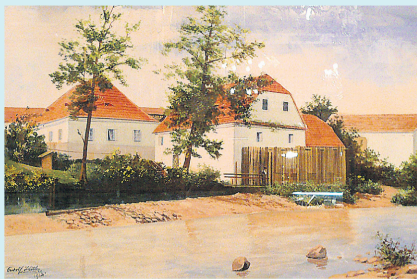
L'aquarelle, Farm Buildings on the River (Hofanlage am Fluss) peinte par Adolf Hitler en 1914.