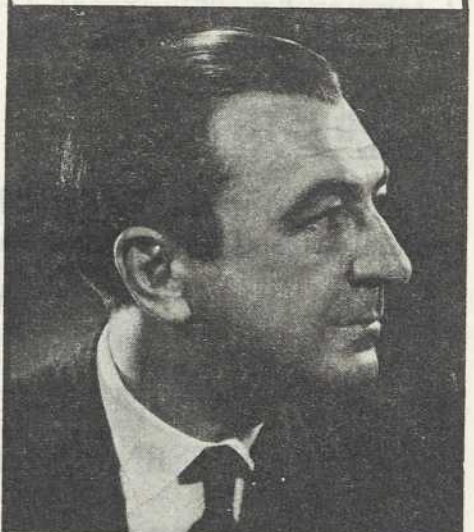
L'HONORABLE FRANCOIS CLOUTIER, m.d. ministre des affaires culturelles et de l'immigration (détails en page 3)

Le Conférencier au déjeuner-causerie, du MARDI, 2 FEVRIER