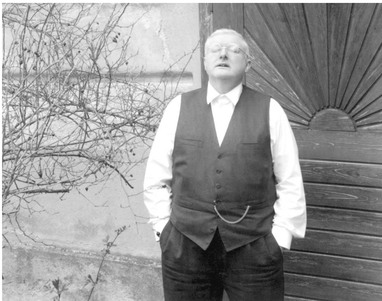
Le cinéaste, gastronome, musicien et essayiste autrichien Peter Kubelka débarque à Montréal pour trois soirs de conférences, dans lesquelles il expliquera en long et en large sa philosophie esthétique pour le moins unique.

Son esprit éclectique lui a valu d'être mis au ban de la société viennoise, et c'est parfois à la mi-taine qu'il a dû créer ses films, expérience qui n'est pas sans compter dans son rapport à ce médium. Kubelka entretient avec la pellicule une relation que les spécialistes qualifient de « sensuelle » ; voir ses films (et les entendre, car l'ouïe est un sens qu'il ne laisse pas en reste), c'est retourner aux sources du cinéma qui, selon lui, n'est toujours pas affranchi (au contraire de la musique ou de la peinture) de