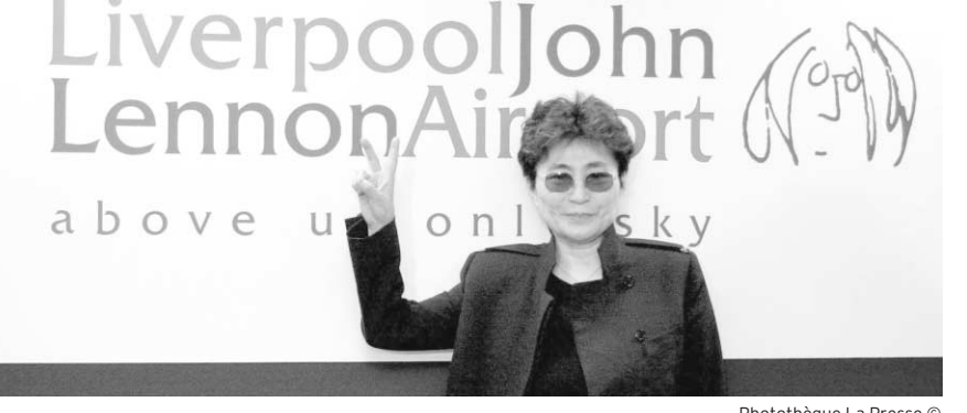
Yoko Ono devant le nouveau logo de l'aéroport de Liverpool qui portera le nom de John Lennon.