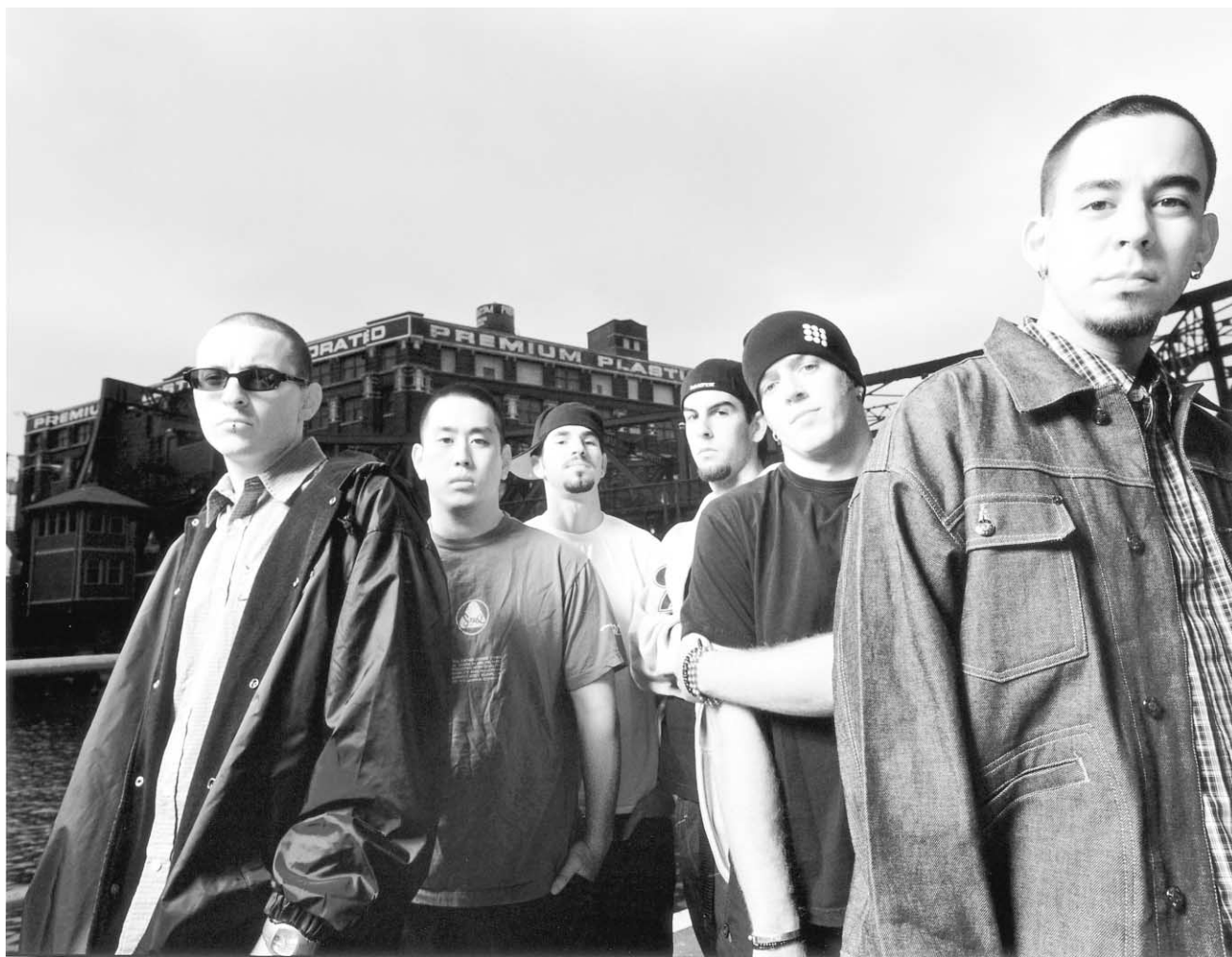
Les membres du groupe Linkin Park.

Apparemment, les fans sont aussi de cet avis, au grand étonnement d'une industrie qui colporte frénétiquement un machisme à ju-