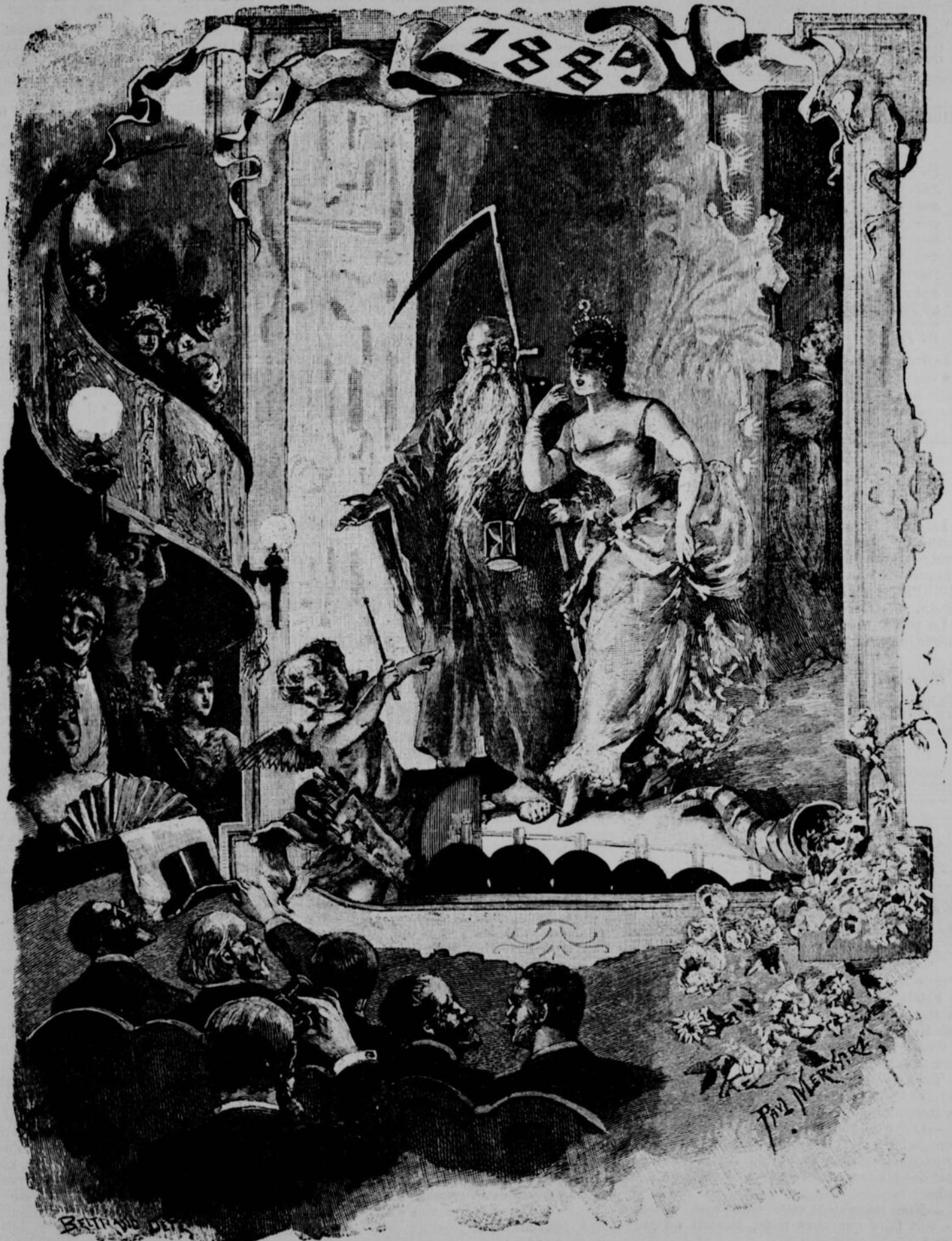
1889. — LA DÉBUTANTE

La ligne, par insertion . . . . . 10 cents Insertions subséquentes . . . . . 5 cents Tarif special pour annonces à long terme