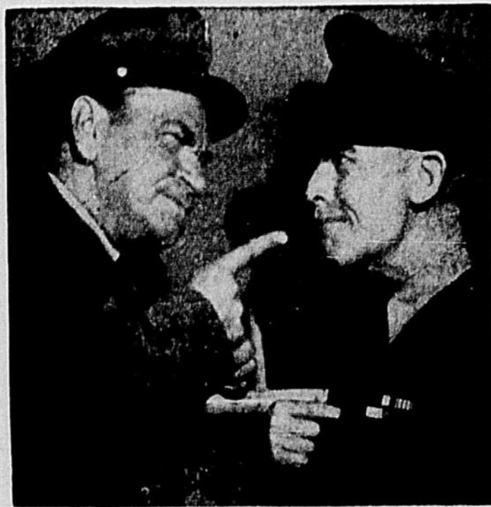
Wallace Beery et James Gleason, réunis dans le film "THIS MAN'S NAVY", qui passera à l'écran du Princess.