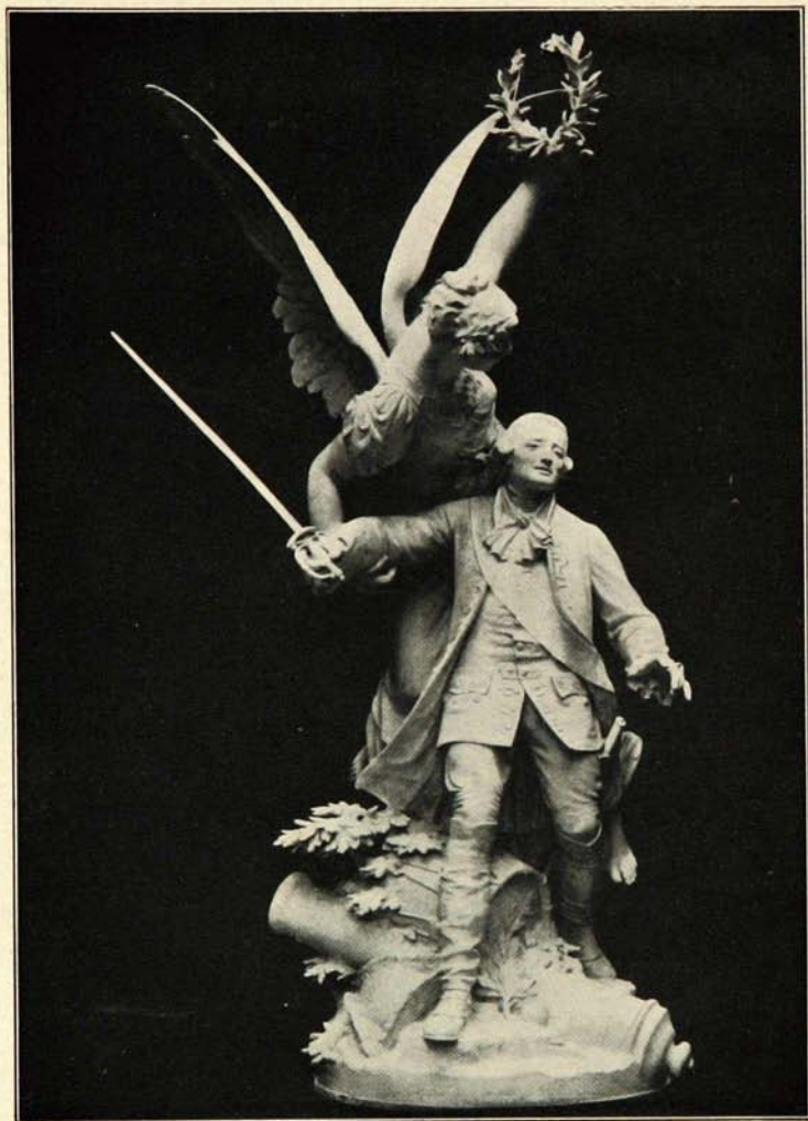
STATUE de MONTCALM de Léopold MORICE