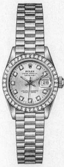
OYSTER PERPETUAL LADY-DATEJUST CADRAN ET LUNETTE SERVIS DE BRILLANTS