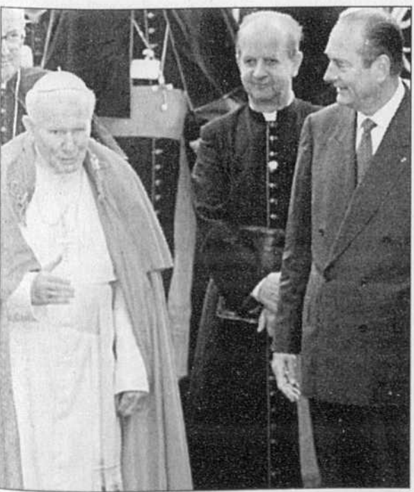
Le pape Jean-Paul II fut reçu avec toute la pompe due aux chefs d'État lors de dernier voyage en France, en septembre dernier.