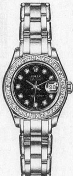
OYSTER PERPETUAL LADY-DATEJUST CADRAN ET LUNETTE SERVIS DE BRILLANTS

Day-Date et Lady Datejust sont les plus prestigieux modèles de la