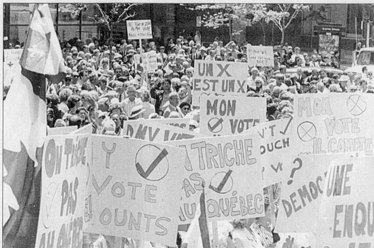
La manifestation d'appui à l'unité canadienne, au centre-ville de Montréal, peu avant le dernier référendum. Depuis, les rapports entre les communautés francophone et anglophone n'ont cessé de se détériorer.

Quelles sont les conséquences d'un tel processus et comment peut-on re-