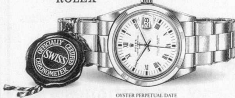
OYSTER PERPETUAL DATE

Nous sommes fiers d'être votre bijoutier agréé Rolex.