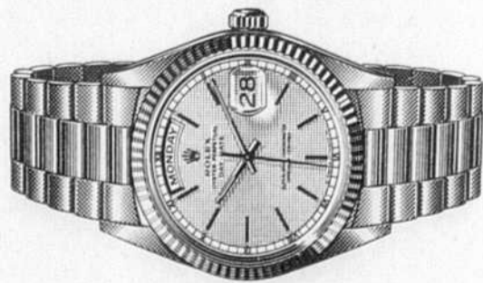
OYSTER PERPETUAL DAY-DATE

Nous sommes fiers d'être votre bijoutier agréé Rolex.