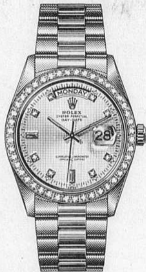
OYSTER PERPETUAL DAY-DATE CADRAN ET LUNETTE SERVIS DE BRILLANTS

Elle représentent près d'un siècle de la créativité et innovation de Rolex. Le boîtier est entièrement taillé dans un bloc de platine ou d'or 18 carats et leur création requiert toute une année de travail. Les chronomètres