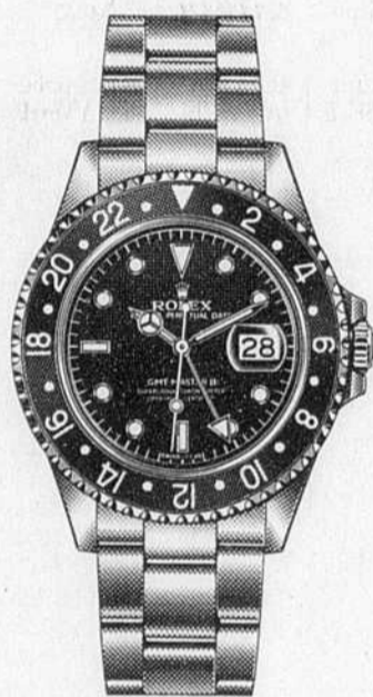
OYSTER PERPETUAL GMT-MASTER II

Elle représentent près d'un siècle de la créativité et innovation de Rolex. Le boîtier est entièrement taillé dans un bloc de platine ou d'or 18 carats et leur création requiert toute une année de travail. Les chronomètres