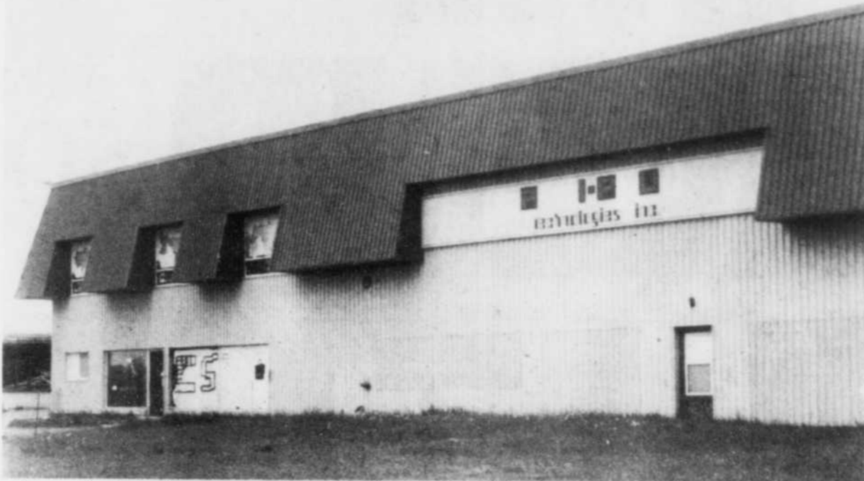
Les employés syndiqués rentreront progressivement au travail, à la suite du règlement du conflit à l'usine Posi-Plus Technologies dans le parc industriel de Victoriaville.

sin Continental du centre-ville de Victoriaville est maintenant rouvert et les syndicats de la compagnie de pièces automobiles Motoparts de Plessisville sont rentrés au travail.