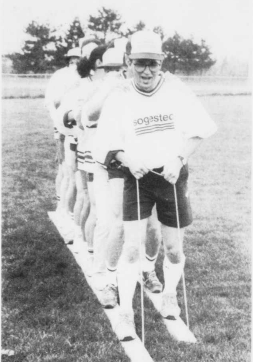
L' preuve du ski de fond   dix personnes n'est pas de tout repos et les membres de la compagnie Sogastec de Victoriaville en ont eu la preuve.