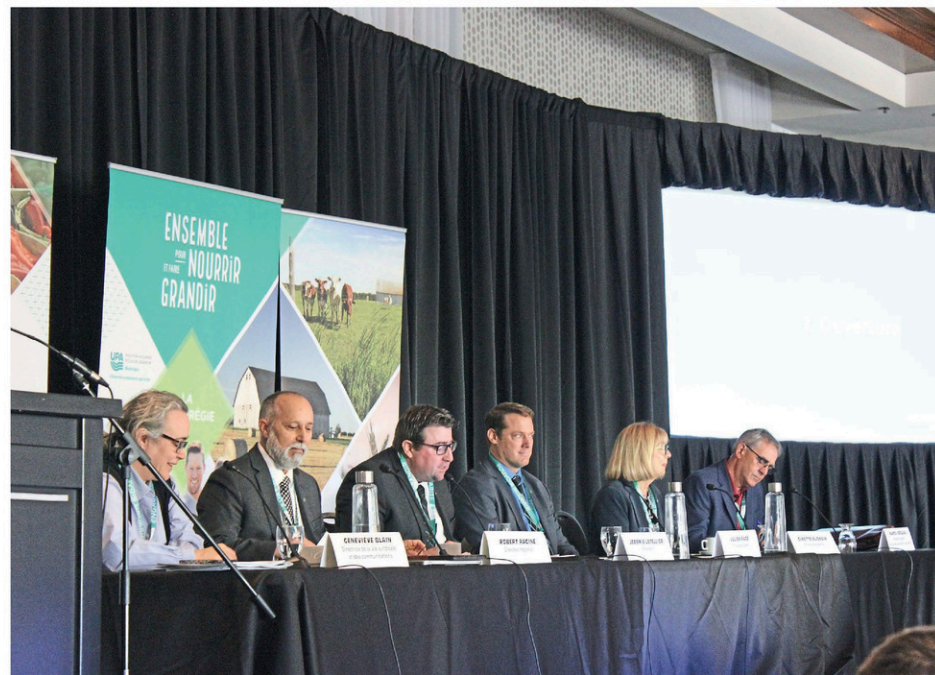
L'assemblée générale annuelle de la Fédération de l'UPA de la Montérégie s'est tenue le 7 octobre.

Cette résolution stipule que "l'UPA Montérégie et la Confédération feront les représentations nécessaires afin que soient