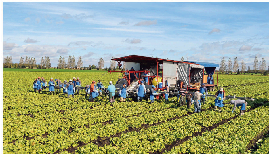
Pour de nombreuses entreprises agricoles de la région, l'embauche de travailleurs étrangers temporaires est essentielle.