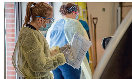
Il sera possible de prendre rendez-vous à compter du 25 novembre, à 16 h 30.

Les personnes de 6 ans ou plus qui répondent à certaines conditions peuvent se faire dépister par gargarisme. Pour ce faire, il faut éviter de boire ou manger, de fumer ou vapoter, de se brosser les dents et de mâcher de la gomme au moins une heure avant le test de dépistage.