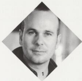
Mise en scène JONATHAN RACINE 1

Ponctuées de références populaires, de Barbra Streisand à The Price is right , cette pièce évoque la distance qui existe entre la vie rêvée et celle que l'on a vécue.