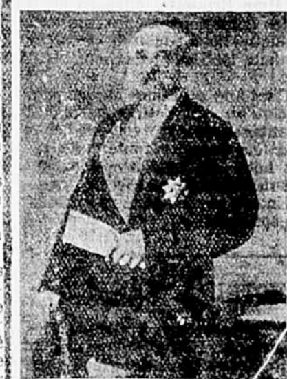
FEU L'HON. JUGE BABY

Lors des difficultés qui survinrent à propos de l'établissement d'une succursale de l'Université Laval à Montréal, M. Baby fut chargé d'une mission très délicate auprès du Saint Siège, mission qu'il mena à bonne fin et qui lui valut de la part de Pie IX, alors pape régnant, la haute distinction de Grand Croix de l'ordre papal de Saint Grégoire de Tours.