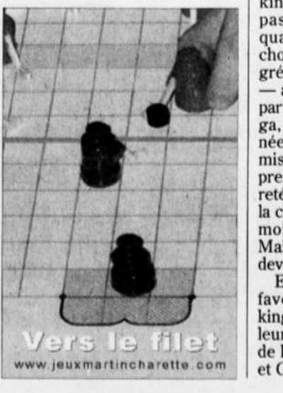
Vers le filet www.jeuxmartincharette.com