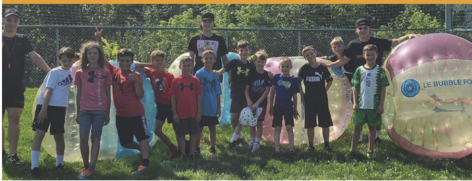
Première édition de l'école de hockey La Relève.