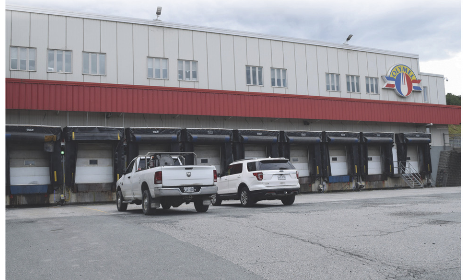
L'échéance approche à l'usine d'Olymel à Vallée-Jonction.