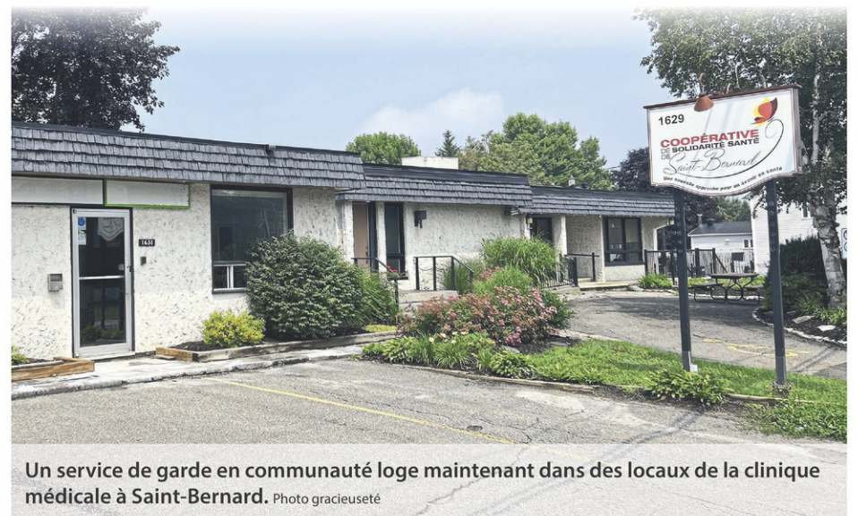
Un service de garde en communauté loge maintenant dans des locaux de la clinique médicale à Saint-Bernard.