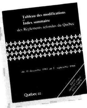
Tableau des modifications et Index sommaire des Règlements refondus du Québec du 31 décembre 1981 au 1 er septembre 1988