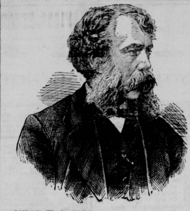
L'HON. H. G. JOLY, député de Lotbinière.

C'est la saison des filles qui tombent de la nature, comme dit le proverbe. Les filles qui tombent de la nature, comme dit le proverbe. Les filles qui tombent de la nature, comme dit le proverbe.