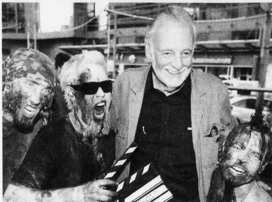
Le maître de l'épouvante, George A. Romero, en macabre compagnie. En 1968 avec 10 000 $ et des copains déguisés en zombies, le cinéaste créait le premier film de morts-vivants, The Night of the Living Dead , devenu une œuvre cultissime.

« Je ne fais pas de films sur les zombies, mais sur la manière dont les gens transigent avec leurs problèmes , précise-t-il, en