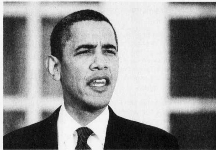
Le président Barack Obama en conférence de presse, vendredi dernier, à la Maison-Blanche.

stratégie en communications chevronnée du Parti démocrate avait, dans le magazine Time , dénoncé Fox News comme une chaîne de «journalisme d'opinion