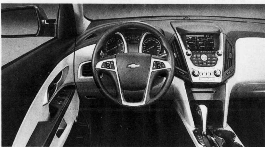
La présentation intérieure est moins fade, plus jazzée, que celle du modèle précédent, mais le plastique y règne toujours en maître.

arrière est plus ferme, mais pas inconfortable pour autant et, comme c'est souvent le cas dans ce type de véhicule, il y a beaucoup d'espace pour la tête et les jambes. Ça tombe bien, c'est en partie pour ça que les gens en achètent. Le coffre à bagages est lui aussi très logeable.