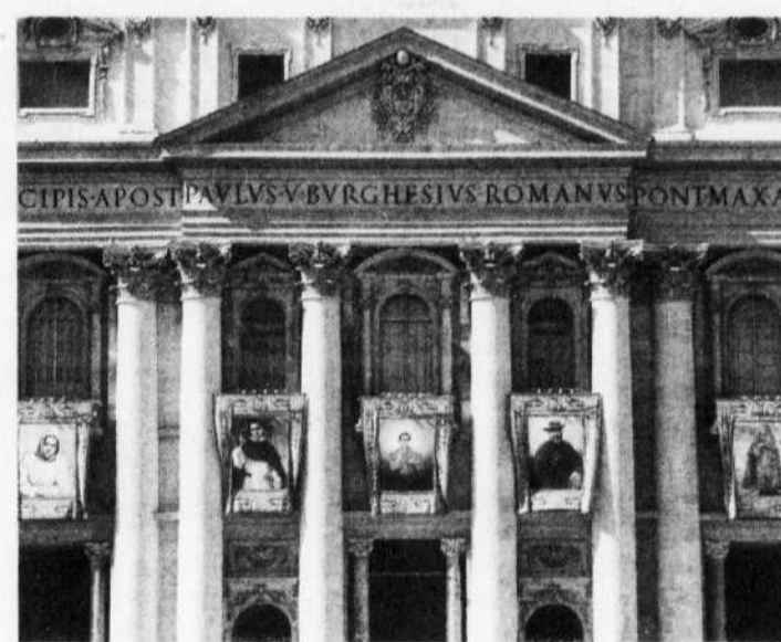
FRANÇOIS LENOIR REUTERS

Le souverain pontife a également canonisé deux figures religieuses espagnoles — Francisco Coll y Guitart et Rafael Arniá — et un évêque polonais, Zygmunt Szezesny Felinski, lors d'une messe à la basilique Saint-Pierre à laquelle assistait le premier ministre français, François Fillon, reçu la veille par Benoît XVI.