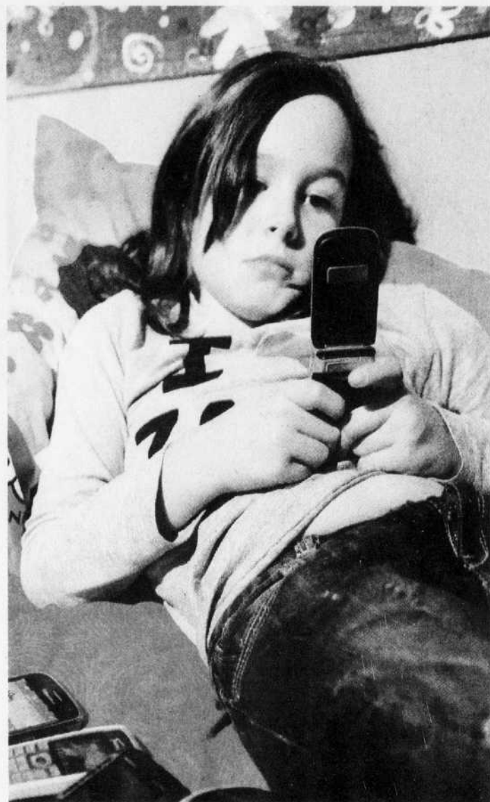
DENIS CHARLET AGENCE FRANCE-PRESSE

Le Wall Street Journal publiait hier un article intitulé Why Email No Longer Rules , au sujet du courriel qui perdait sa place et se voyait détrôner par les réseaux sociaux. Comme le soulignait l'auteur Jessica E. Vascellaro, il est étonnant de