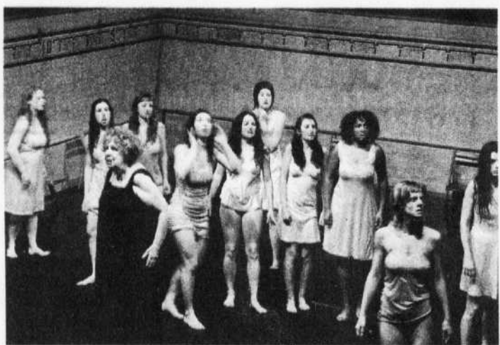
Les Troyennes raconte le sort que des soldats grecs réserveront aux femmes au lendemain de la guerre de Troie.