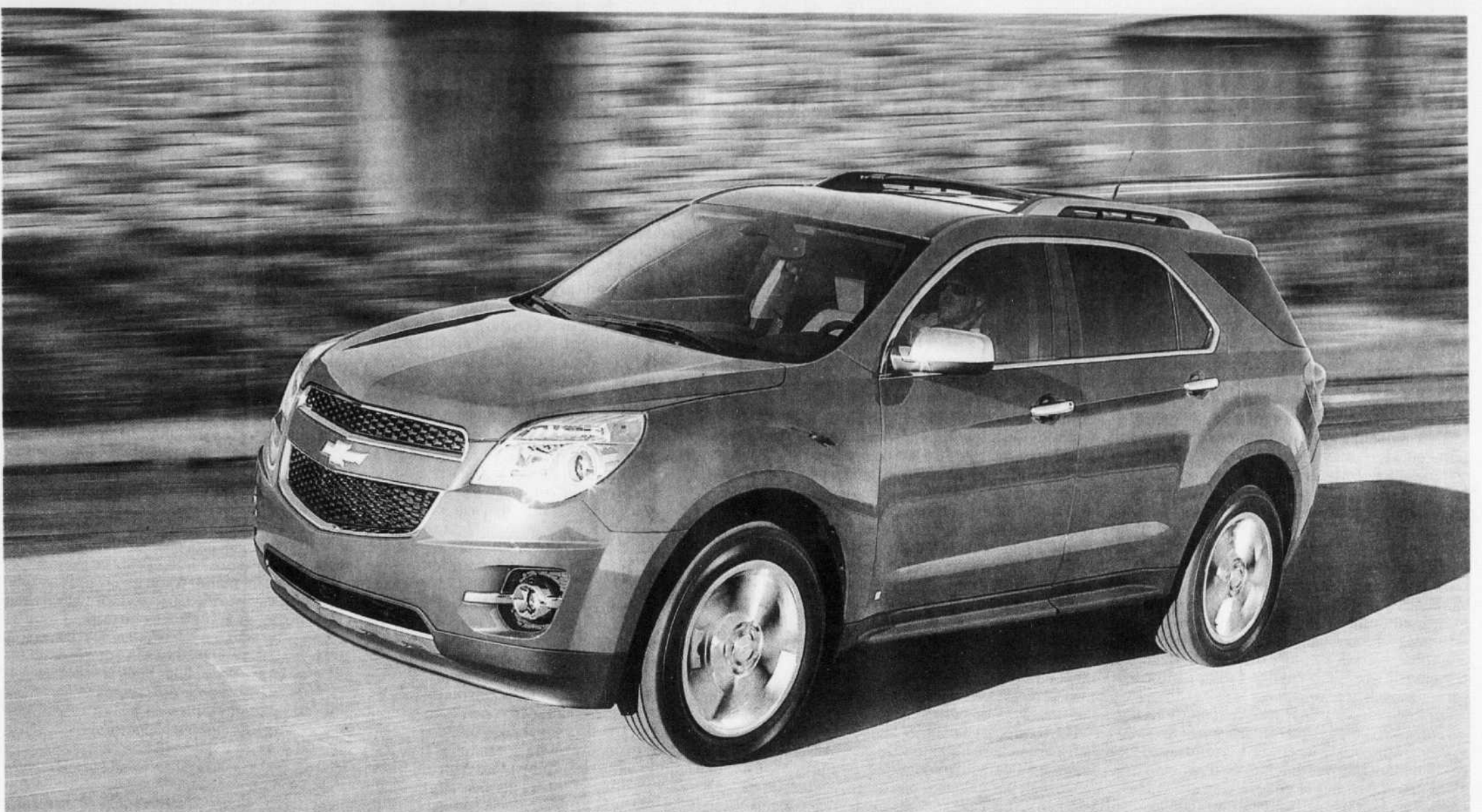
L'Equinox affiche un look costaud, très «camion», qui plaira à la clientèle visée même si, dans les faits, il s'agit d'une auto déguisée en VUS.