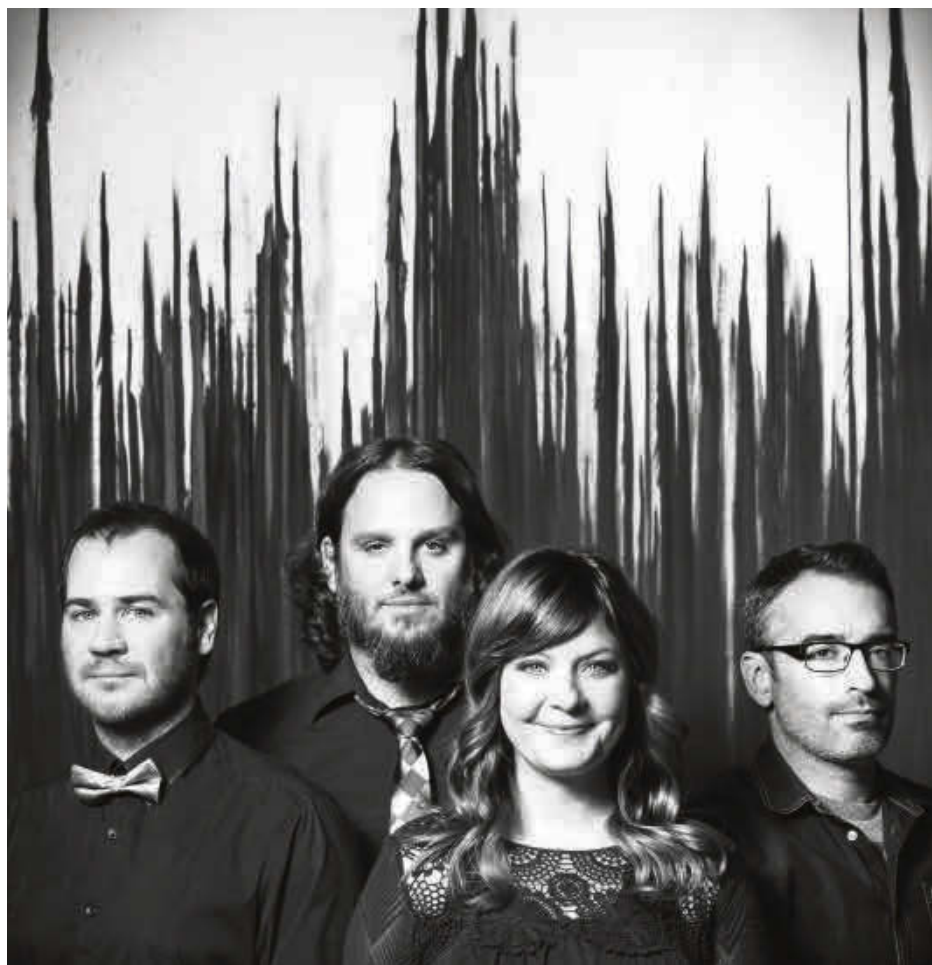
Les Cowboys Fringants, qui ont connu un immense succès lors de leur prestation au Show de la rentrée d'Acton Vale en 2014, seront de retour pour la 11 e édition, soit le samedi 19 août.

Quant à la programmation, elle sera dévoilée sous peu. Information: www.leshowdelarentree.com .