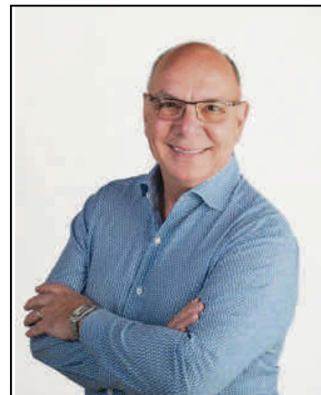
Un ambassadeur en or pour le Relais pour la vie