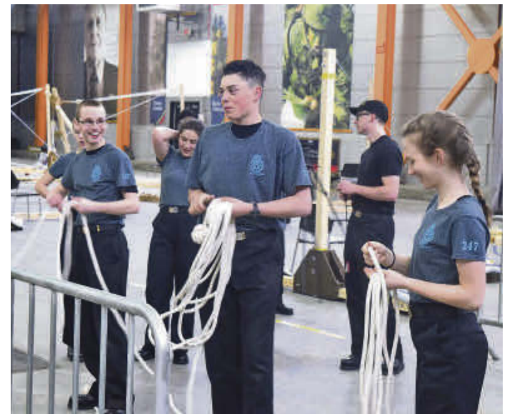
Les Timoniers de Valcourt lors de l'épreuve du lancer de cordage durant la compétition provinciale de matelotage à Valcartier.