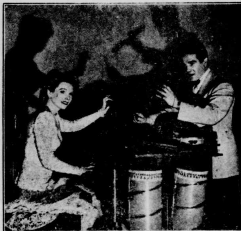
Scène du film musical "Scandals", qui sera à l'affiche de l'Impérial pour 4 jours, à compter de dimanche, le 20 janvier.