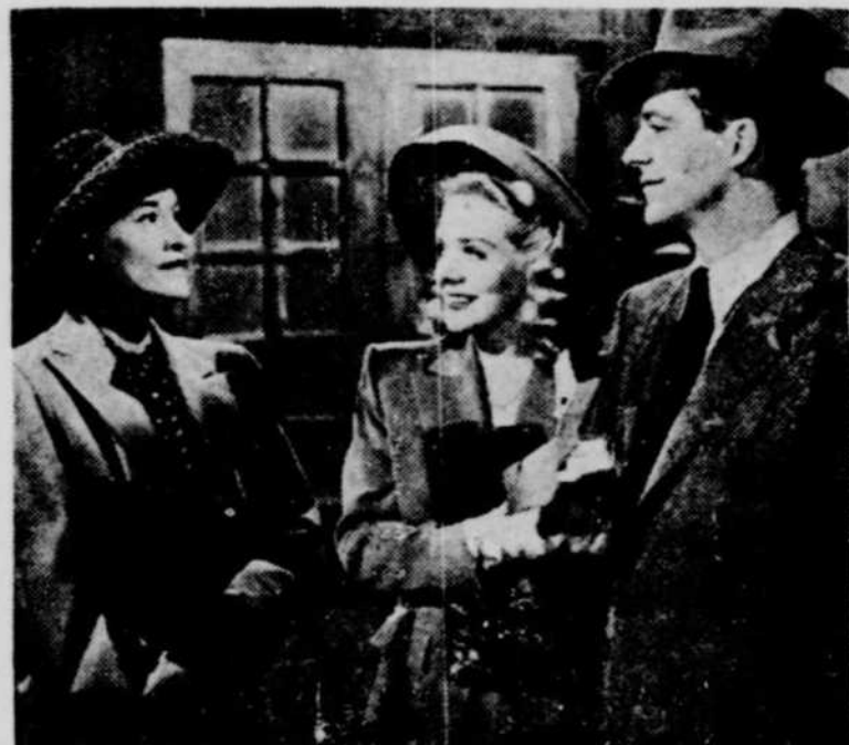
Alice Faye, Dana Andrews, Linda Darnell, dans une scène du film dramatique "Fallen Angel", à l'affiche pour 4 jours, à compter de dimanche, au Cartier.