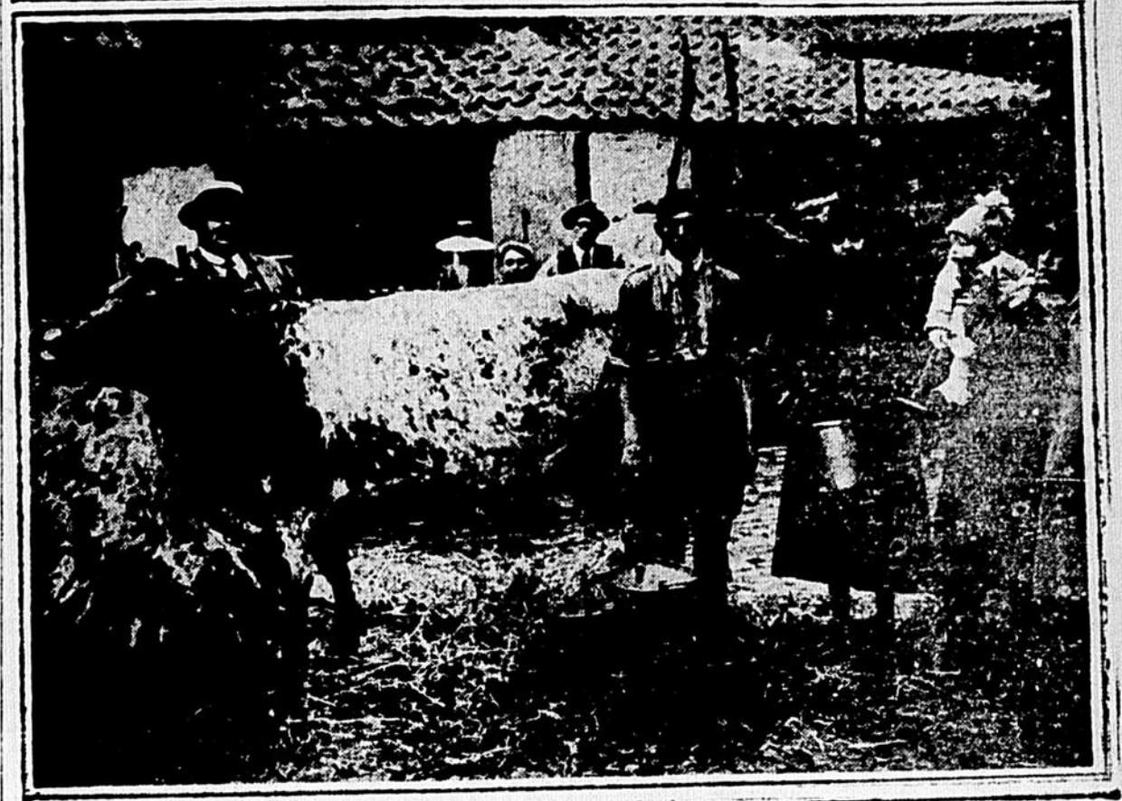
LES BOCHES, à qui la France et la Belgique réclament les vaches volées pendant l'occupation, prétendent que leurs "petits" mourront de faim sans ces bonnes laitières.