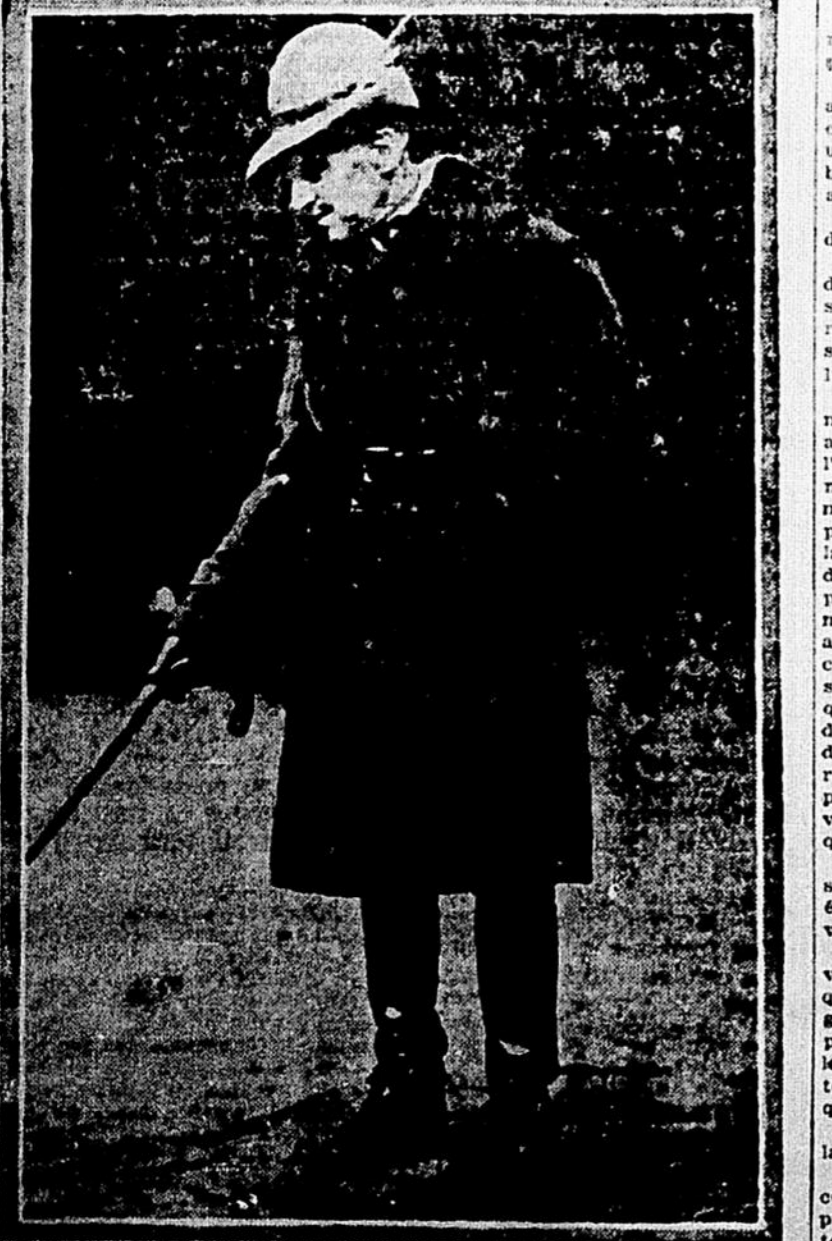
MARIELE D'ANNUNZIO, qui a déclaré la guerre à l'Italie et a conclu un traité de paix avec elle dans la même semaine.