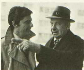
Ennemis comme avant

CKRN 4 Rouyn-Noranda CHAU 5 Carleton CKRT 7 Rivière-du-Loup CKSH 9 Sherbrooke CKRS 12 Jonquière CKTM 13 Trois-Rivières