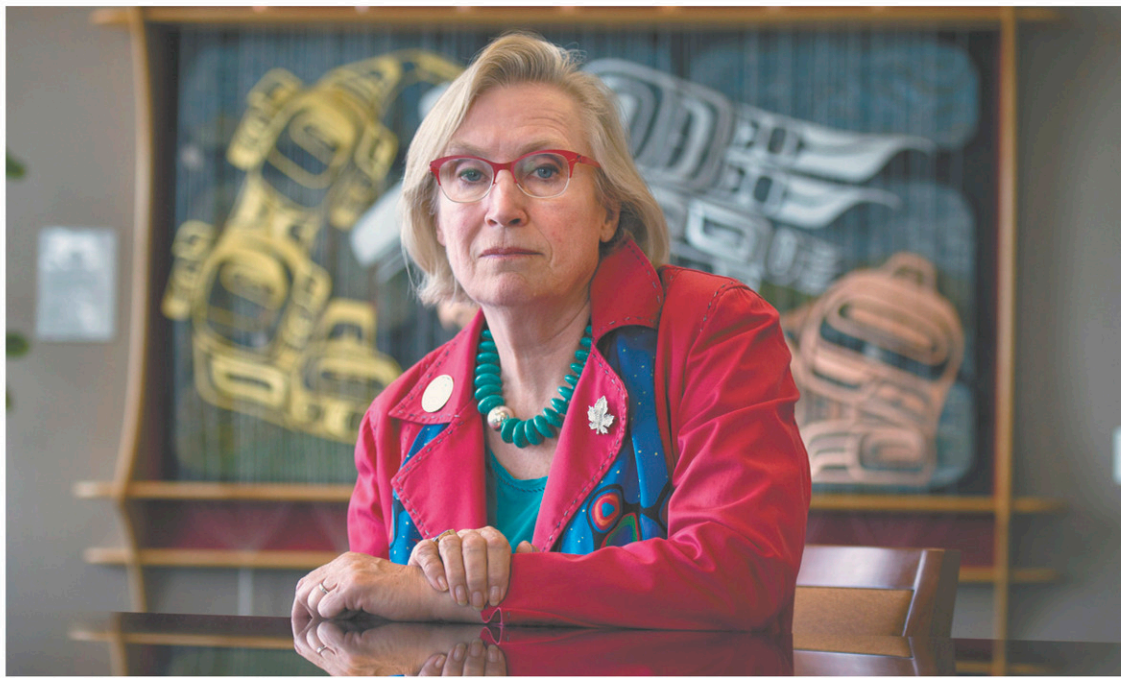
La ministre des Relations Couronne-Autochtones, Carolyn Bennett

La commission d'enquête avait demandé à Ottawa 50 millions de dollars supplémentaires en mars dernier. La ministre Bennett n'a pas chiffré la facture du délai additionnel de six mois. Il faudra en discuter avec les commissaires, a-t-elle martelé. « Il n'y