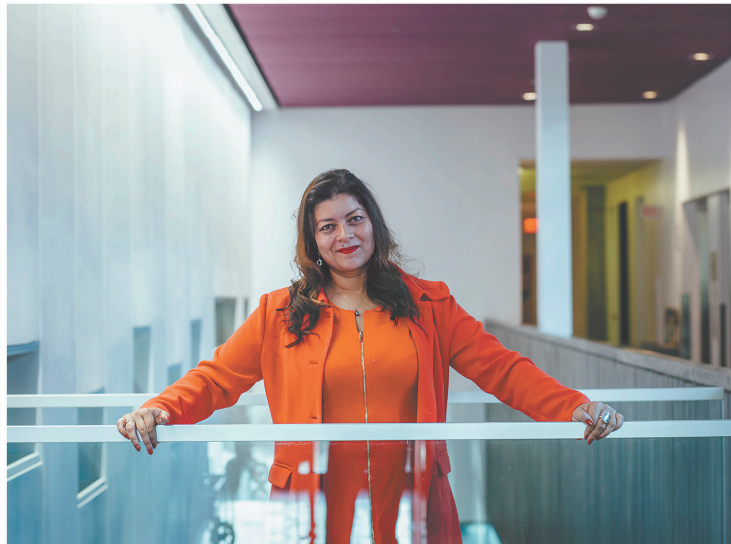
Instigatrice du mot-clic #BalanceTonPorc, la journaliste Sandra Muller était de passage mardi à Montréal.