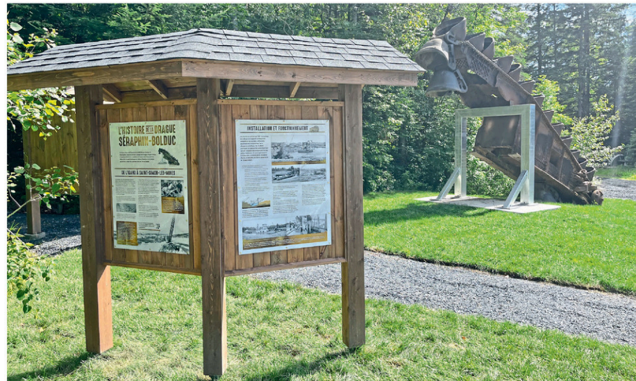
Les panneaux historiques et les morceaux de la Drague Séraphin-Bolduc ont été installés à l'entrée de la Promenade des Mines.