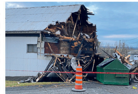
Incendie de nature suspecte à Saint-Côme-Linière.

De plus, Bolduc fait face à huit autres chefs reliés aux armes. Toujours selon le document, on lui reproche d'avoir eu en sa possession une arme dans un dessein dangereux, d'avoir intentionnellement fait feu en direction d'un lieu