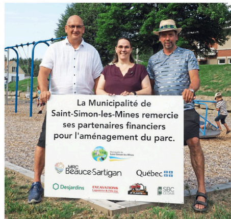
Inauguration du nouveau parc municipal, de la Promenade des Mines et des vestiges de la Drague Séraphin-Bolduc à Saint-Simon-les-Mines.

La drague a été construite en 1939 à Marysville en Californie. Active de son année de fabrication jusqu'en 1955 aux États-Unis, la Beauce Placer en fait son acquisition vers 1956. La drague arrive en Beauce en mars 1961 et s'active le long de la rivière Gilbert au printemps. Elle œuvre dans la région jusqu'en 1964. Initialement, la Beauce Placer prévoyait opérer la drague durant minimum huit ans.