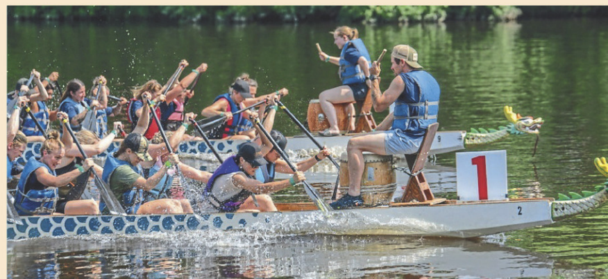
La course bateaux-dragons saint-georges s'est déroulé le 15 juillet.

Il s'agissait de la 13 e édition de l'événement organisé par le Comité des fêtes de Saint-Georges. Ce dernier tient d'ailleurs à remercier ses partenaires, les rameurs, ainsi que les 50 bénévoles qui contribuent à son succès. (S.R.)