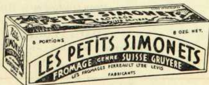
"LES PETITS SIMONETS"

que notre expert a voulu faire connaître par son nom si réputé dans le domaine de l'industrie fromagère.