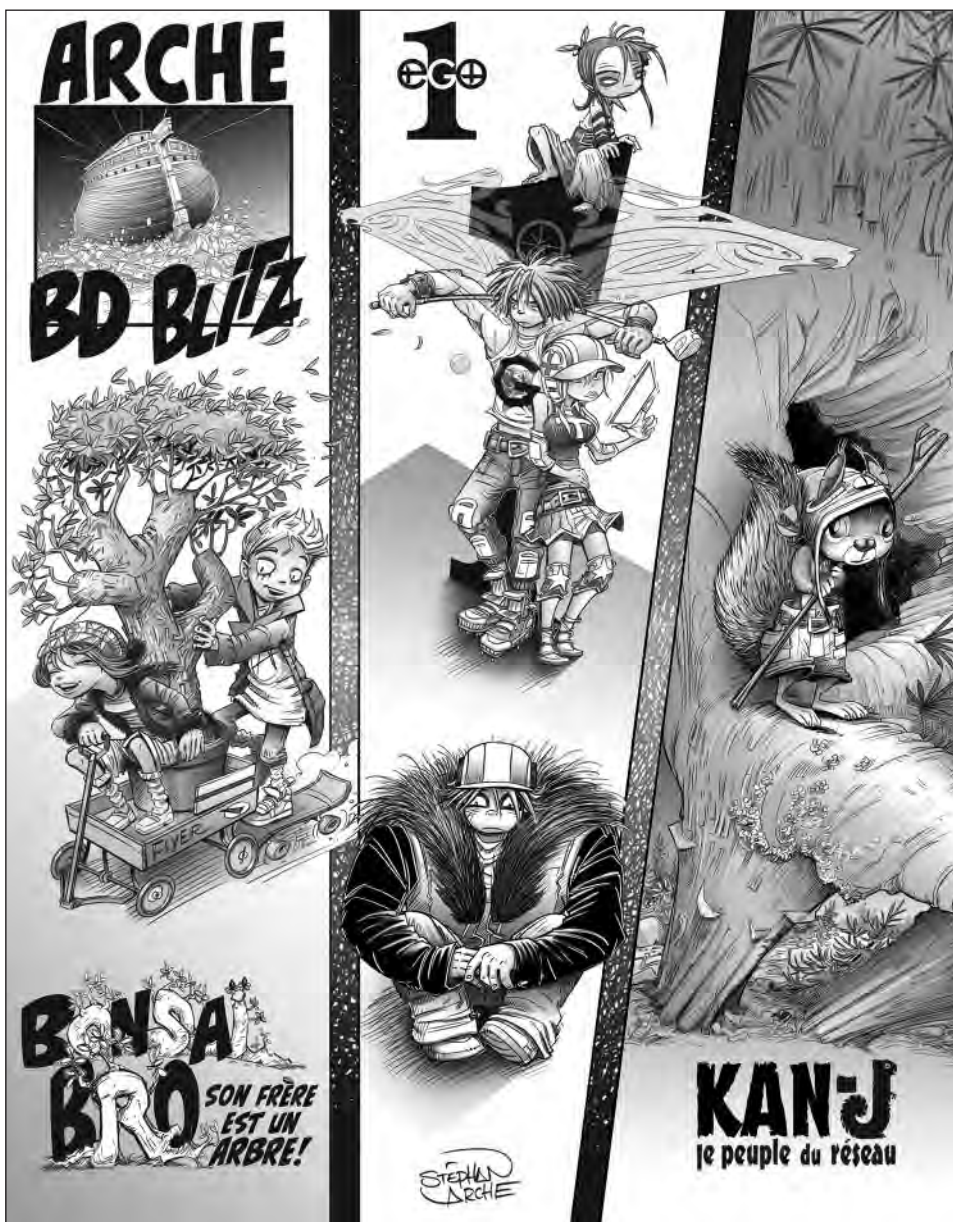
© ARCHE, le bédéiste Stéphan Archambault

QUAND : 19 avril 2017 d'une durée de 1 h 30. Groupe 1 : 4 e , 5 e , 6 e année primaire à 15 h 30. Groupe 2 : 1 e , 2 e , 3 e , 4 e et 5 e secondaire à 19 h.