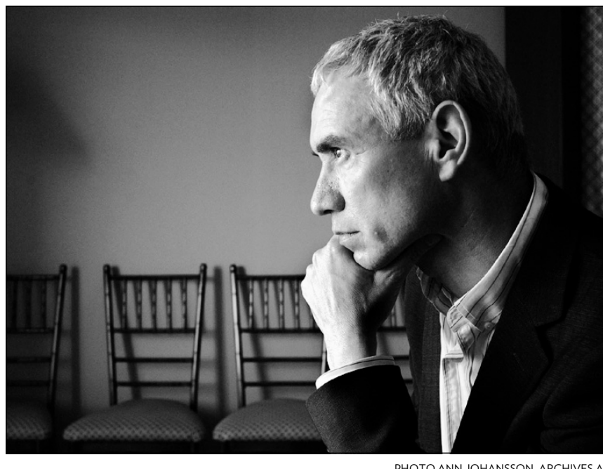
Le metteur en scène allemand Roland Emmerich ( Le Jour d'après ) présidera le jury de la 55 e Berlinale.

Plusieurs films retraçant les drames des guerres seront diffusés : Sophie Scholl, les derniers jours de l'Allemand Marc de Robert Guédiguian et Le jour d'après de Roland Emmerich. Les dernières 48 heures de deux kamikazes palestiniens seront ra-