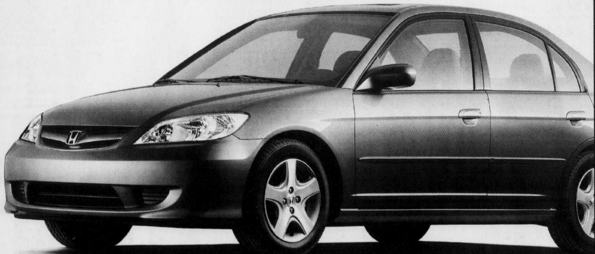
Berline Civic Si illustrée

Incluant 120 000 km Transport et préparation inclus en location seulement