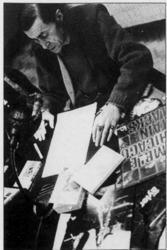
TINY VAN DIJK

La deuxième phase du parcours de Straram commence avec son passage dans les milieux hippies de la Californie de 1968 à 1970. Lorsqu'il quitte Montréal, Straram donne l'image d'un intellectuel de la rive gauche et d'un contestataire pur. À son retour, Straram adopte l'apparence physique qu'il conserve jusqu'à sa mort: celle de l'Amérindien errant et marginalisé. Cette image participe de son projet de transformer la vie quotidienne et d'achever la maîtrise de l'espace et de l'histoire.