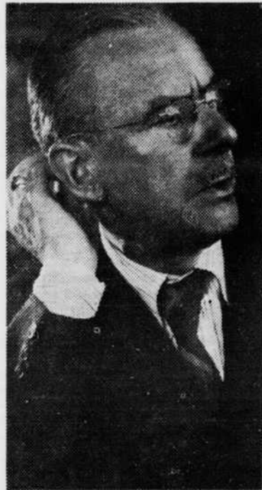
Thomas Mann, tel que le connurent les Canadiens, lors d'une conférence qu'il donna à Montréal il y a quinze ans.

Dès la parution de son premier livre en 1898 : "Der Kleine Herr Friedemann", Thomas Mann se