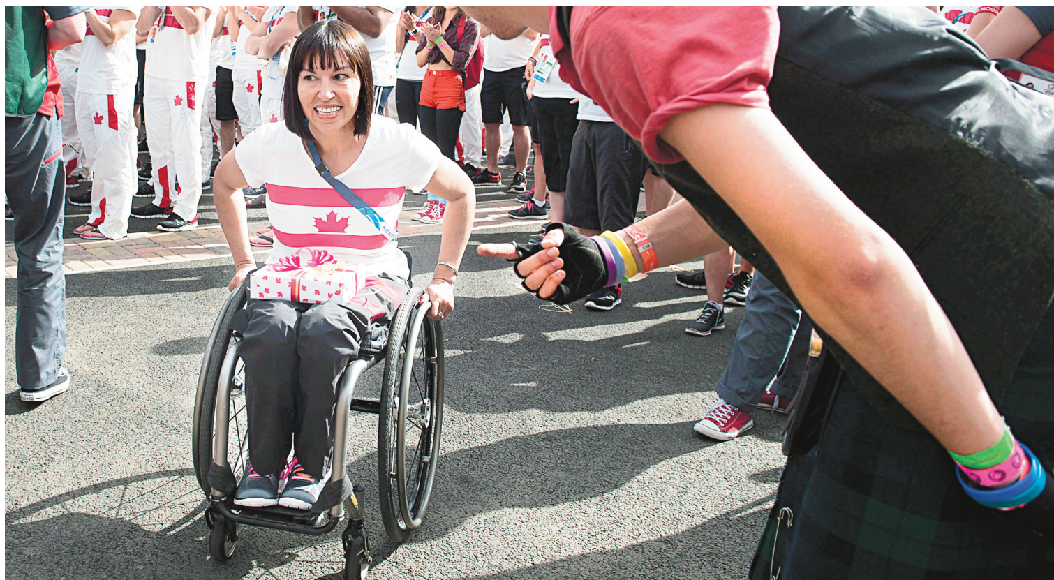
Chantal Petitclerc, chef de mission de la délégation canadienne: «Après 20 années à penser juste à moi et à ma propre performance, c'est une belle sensation de ressentir de l'empathie et de souhaiter ce qu'il y a de mieux à tous les autres athlètes.»