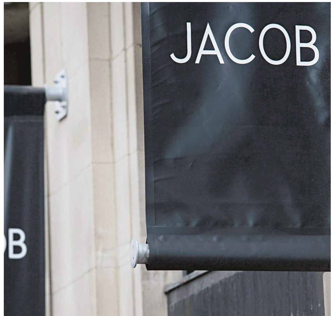
GRAHAM HUGHES LA PRESSE CANADIENNE

L'entreprise annonçait au début de mai devoir fermer boutique. Forcé de constater l'échec de sa restructuration, le