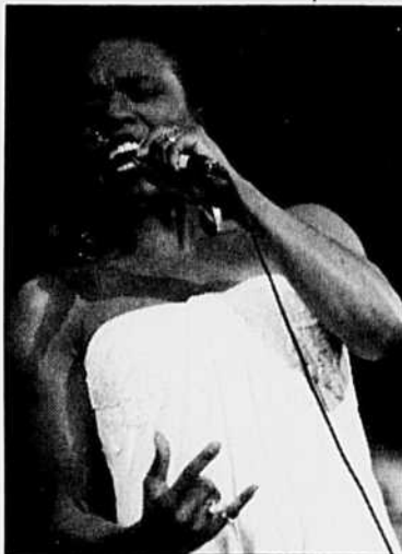
Dee Dee Bridgewater a donné le meilleur d'elle-même

Qu'on l'écoute: «Taste me with your kisses/ Find my secrets how to love you/ Show me how to please you.» Puis? Euh... C'est elle qui l'a dit. C'est elle qui l'a chanté en compagnie de trois prosateurs aussi complices entre eux qu'avec elle, qu'ils participaient, plus qu'ils n'accompagnaient, aux chants de l'amour de Denise Bridgewater qui, il y a quinze jours à peine, a campé là... Carmen chère à Bizet.