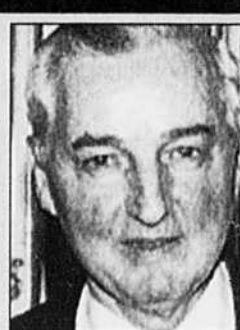
Paul Desmarais 615 millions$