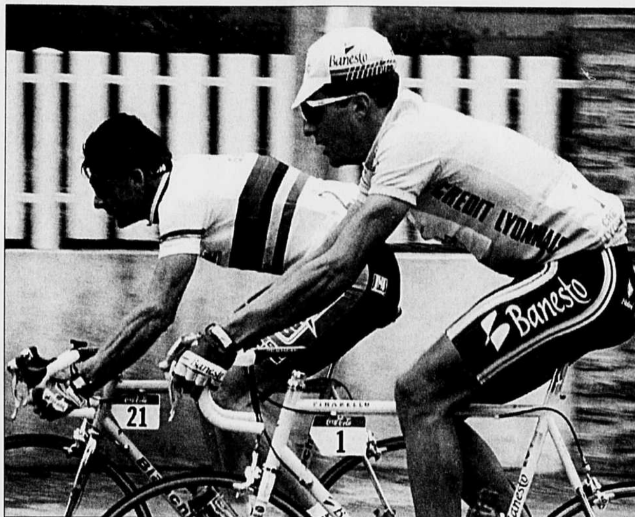
Le champion du monde Gianni Bugno, à gauche, et le «roi» Miguel Indurain, défendant du titre, ont roulé côte à côte durant la seconde étape du Tour de France disputée hier entre les Sables-d'Olonne et Vannes.