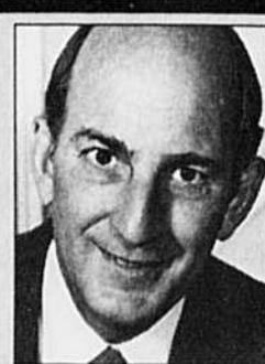
Charles Bronfman 3,3 milliards$