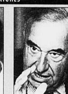
Jean Coutu 472 millions$