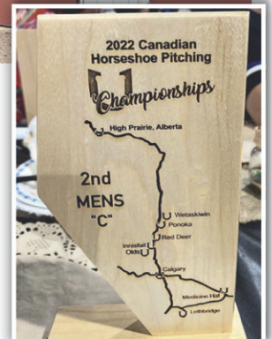
Le trophée remporté par Éric Thibault.

Éric Thibault tire une grande fierté de son sport et encourage les jeunes à oser l'essayer. Depuis qu'il le pratique, il n'a qu'un seul regret: « Ne pas avoir commencé à jouer plus tôt. J'aurais pu être encore meilleur aujourd'hui! ».