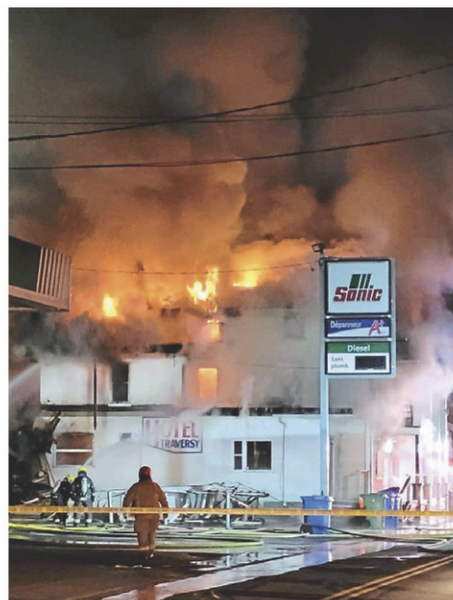
L'Hôtel Traversy a été rasé par les flammes la semaine dernière.