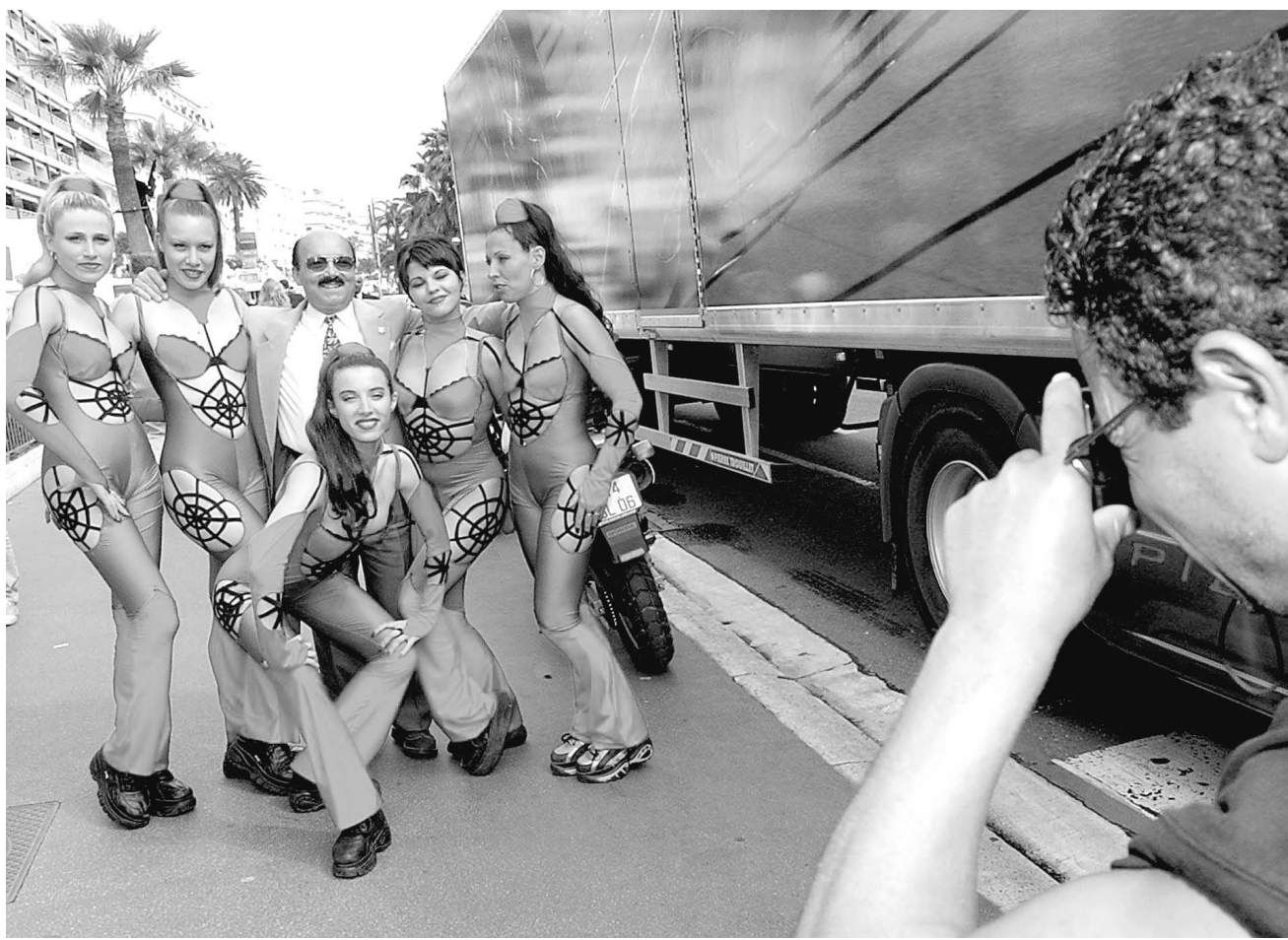
Les promoteurs de Spider-Man savent comment faire tomber le public cannois dans leur toile. Pourquoi s'embarasser d'affiches quand il suffit de quelques jeunes femmes en maillots à l'effigie de l'homme-araignée pour attirer l'oeil du passant? Pas très subtil, mais ce n'est pas ce photographe qui s'en plaindra.

Ce reportage a été réalisé à l'invitation de Columbia Pictures.