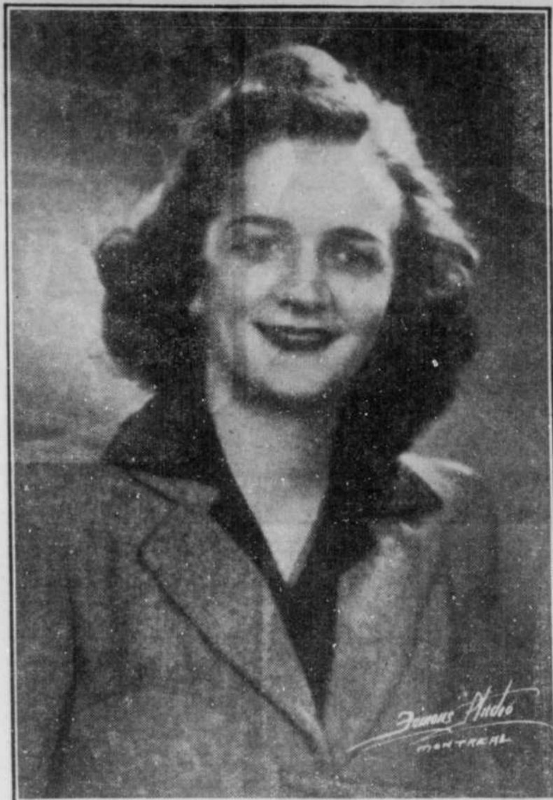
GABY LEFEBVRE, soprano, sera l'artiste invitée cette semaine au programme "Pourquoi?" irradié sur tous les postes français de la province.

Ces grandes auditions, dites les Mercredis Artistiques, sont données à la Galerie des Arts.