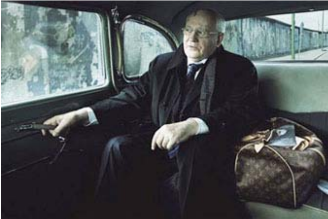
Mikhaïl Gorbatchev et Louis Vuitton