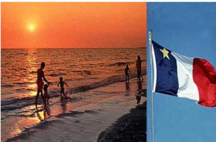
Plage Parlee Beach à Shédiac - N.B.