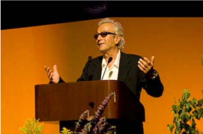
Soirée hommage à Luc Plamondon

Les responsables de la Fondation des Jeunesses Musicales du Canada ont présenté un hommage spécial au compositeur Luc Plamondon (65 ans) à l'occasion du dîner-concert annuel organisé à Dunham dans la région des Cantons-de-l'Est. L'interprétation des oeuvres de Plamondon par des chanteurs d'opéra a démontré que les chansons écrites par l'auteur sont universelles. L'événement a rassemblé plus de 600 personnes dont plusieurs amis de celui qui s'est fait connaître entre autres grâce à l'opéra rock Starmania et Notre-Dame de Paris . Les chanteurs participant au