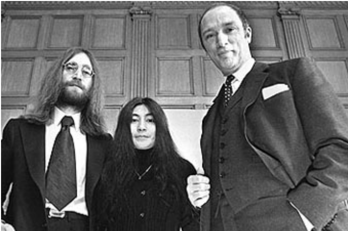
John Lennon, Yoko et Pierre E. Trudeau

L'ex-Premier ministre du Canada Pierre-Elliott Trudeau (1919-2000) peut être aimé ou détesté mais il ne laisse personne indifférent. Son nom est revenu à l'avant-scène récemment lorsqu'un magazine d'histoire d'Ottawa l'a déclaré le pire Canadien de l'histoire. Évidemment, personne n'a pris ce sondage au sérieux mais tous les médias en ont parlé. Cela vient prouver que Trudeau est un personnage qui soulève encore les passions. Ce dernier fut un politicien dont le style était provocateur. On dit que plusieurs Québécois aspiraient à posséder le charisme et l'esprit vif de Trudeau mais qu'ils étaient plus près dans leur affection d'un autre grand politicien: René Lévesque (1922-87). (Voir éditorial de l'éditeur) www.LeStudio1.com/Blogues