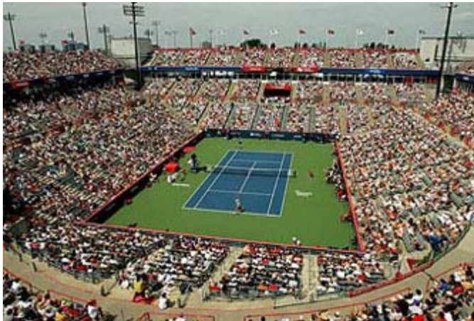
Stade Uniprix à Montréal

Le tournoi de tennis masculin de la Coupe Rogers 2007 séduit encore une fois les amateurs de ce sport et ces derniers peuvent assister à des matchs de très haut calibre alors que les meilleurs joueurs au monde se disputent quelque 2,45 millions $ US en bourses au Stade Uniprix à Montréal. On compare parfois le tournoi de Montréal à celui de Roland-Garros en France et