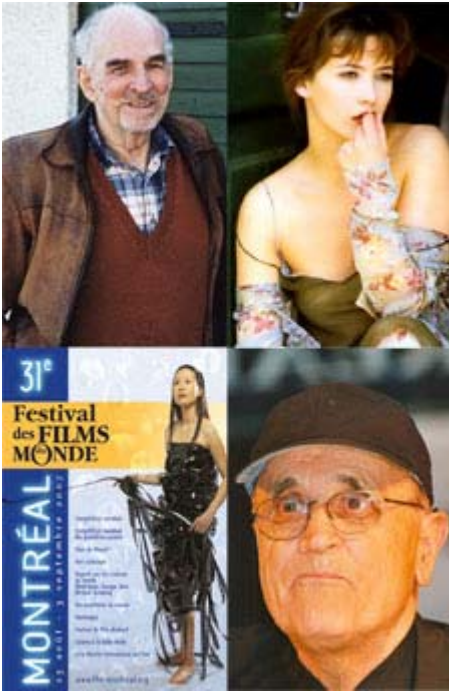
Ingmar Bergman, Sophie Marceau, l'affiche du FFM et Serge Losique

Le président fondateur du Festival des Films du Monde de Montréal, Serge Losique , a mis en place un Festival 2007 qui rappellera les belles années avec une programmation de qualité et des invités de marque. La 31e édition du FFM, qui se déroulera du 23 août au 3 septembre, sera dédié à la mémoire d'Ingmar Bergman (1918-2007) et en tout 230 longs métrages et 215 courts et moyens métrages, provenant de 70 pays, seront projetés dans quatre sites. L'actrice et réalisatrice Sophie Marceau recevra un hommage tandis que plusieurs activités extérieures sont au programme. L'affiche du Festival montre une cinéphile qui est enveloppée de pellicule de film. Selon Losique, certains amateurs peuvent visionner jusqu'à 70 films durant la semaine et l'affiche veut symboliser leur passion du cinéma.