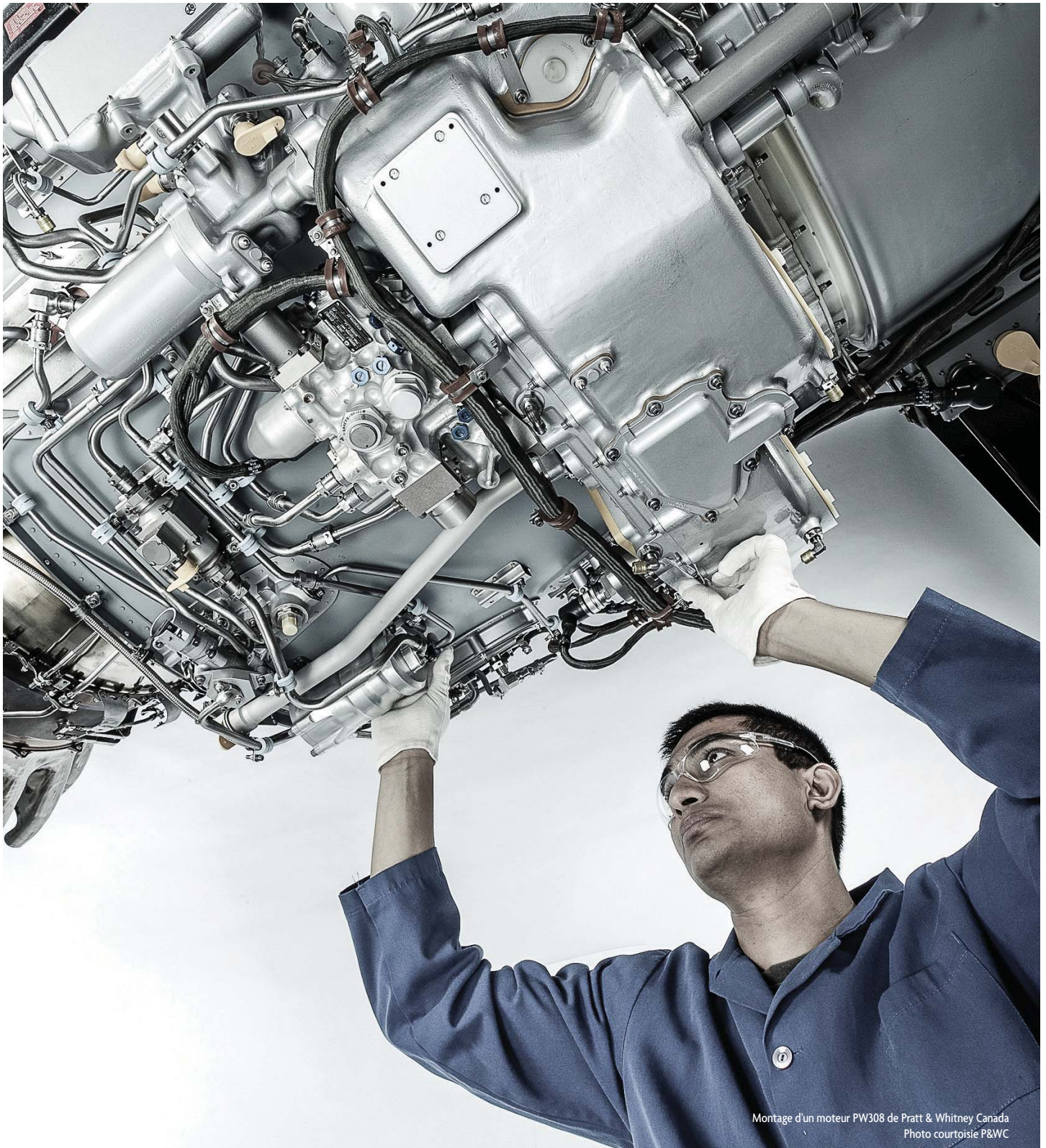
Montage d'un moteur PW308 de Pratt & Whitney Canada

« LA DÉMARCHE EXPLORATOIRE FAITE AVEC LE CRIQ PERMETTRA À APN, NOTRE FOURNISSEUR QUALIFIÉ, DE S'APPROPRIER LA TECHNOLOGIE ET, AU MOMENT VENU, DE FAIRE L'ACQUISITION D'UNE IMPRIMANTE 3D POUR FOURNIR PRATT & WHITNEY CANADA EN PIÈCES OPTIMISÉES. »