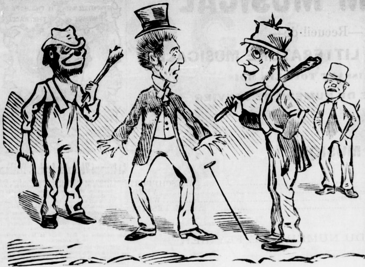
DANS LE GRIFFINTOWN