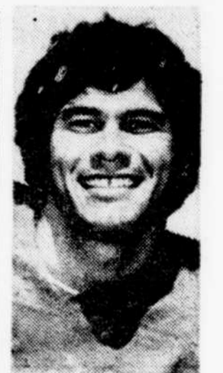
Jim PLUNKETT AP

Québec 185, rue St-Sacrement 687-2525 Charlebourg 280, 47e ouest 627-1010 Repentigny 110, rue Notre-Dame (près du pont) 581-7571 Montréal 10151, rue LaSalle (Salle de montre/démonstrateurs) 381-3024 Hull 981, bd St-Joseph 778-1444