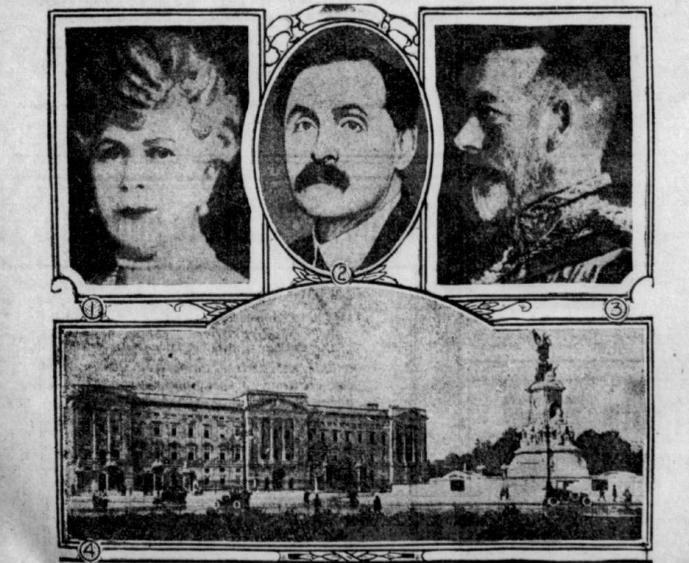
En haut, à droite, la photographie récente du roi en grand uniforme, et celles de la reine et de lord Dawson of Penn, médecin du roi. En bas le palais de Buckingham, résidence royale.

Avez-vous besoin d'imprimés: livres, brochures, revues, journaux, circulaires de tout format, affiches, placards, têtes de compte et autres imprimés de bureau, cahiers, billets, cartes de visites, etc.? Adressez-vous au "Devoir", 430, rue Notre-Dame est, Montréal. (Tél.: Harbour 1241*)