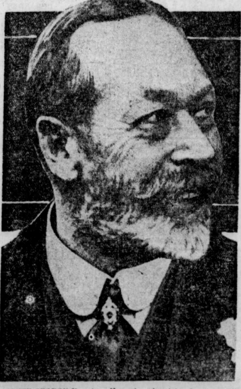
SA MAJESTE GEORGE V, qui souffre de pleurésie depuis quelques jours, semble maintenant hors de danger.

Le prince est à Dar-As-Salam, Afrique, où il attend le croiseur rapide Enterprise qui doit arriver à cet endroit dimanche.