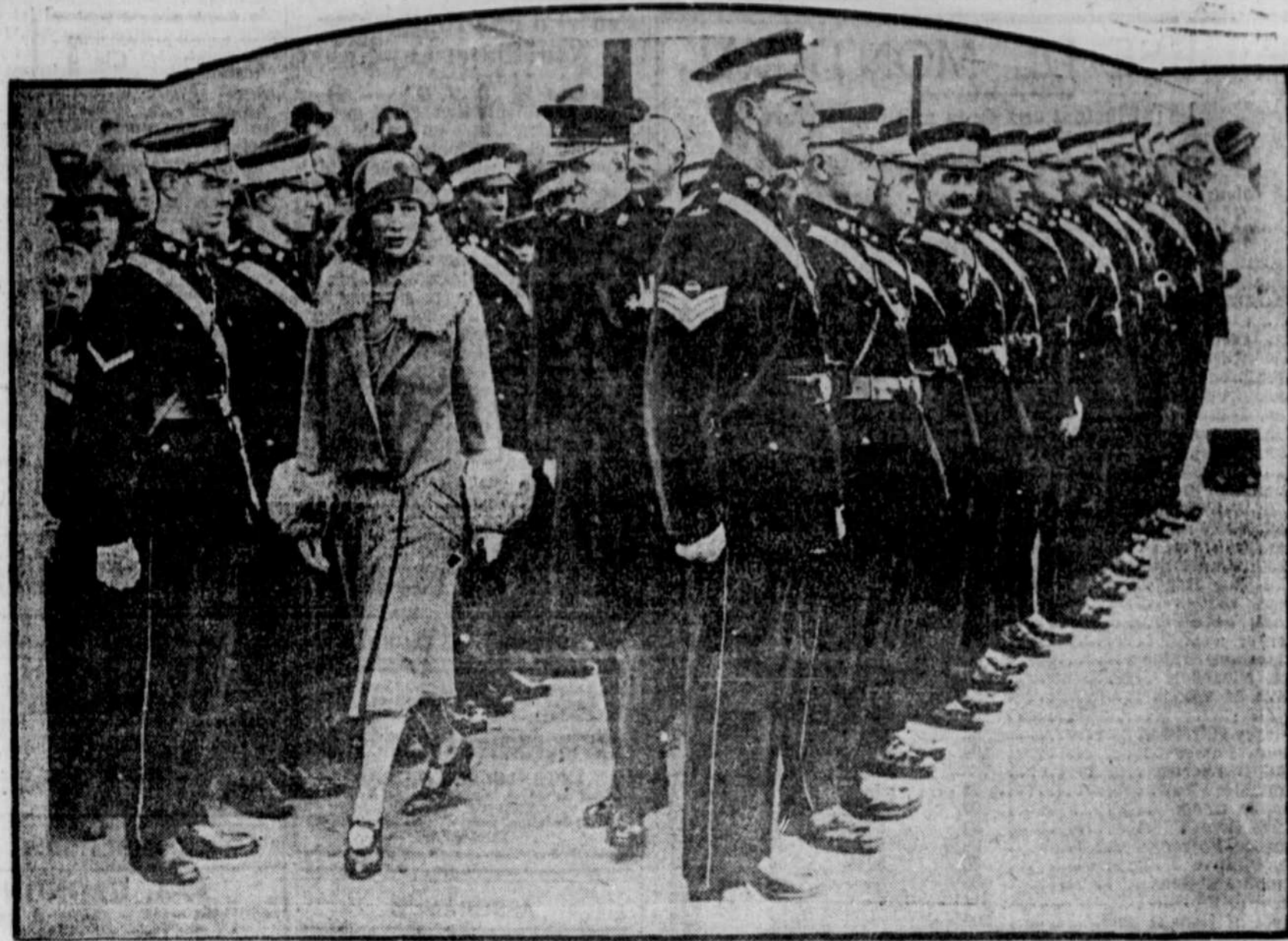
LA PRINCESSE MARIE, fille du roi et de la reine d'Angleterre, inspectant la garde de la "St. John Ambulance", à Londres.