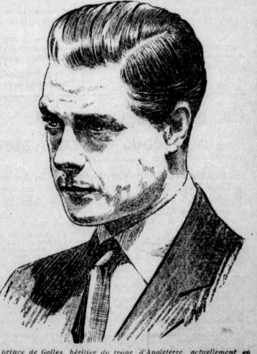
Le prince de Galles, héritier du trône d'Angleterre, actuellement en Afrique, est parti pour Londres par suite de la maladie de son père, le roi George V.