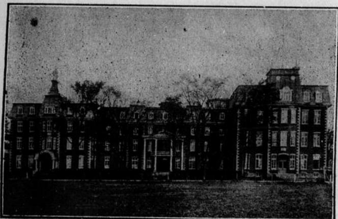
Collège Saint-Joseph de Berthierville.